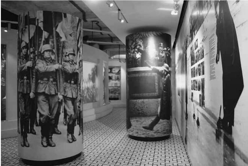
Abb. 18: Schindler-Fabrik, Sektion »Generalgouvernement«.

an eine Distanz zu dem Dargestellten auf. Farbe kommt erst im späteren Abschnitt der Sektion zum Einsatz: Ein arrangiertes Architektenbüro in warmen Holzönen illustriert die Pläne der Besatzer für die Umgestaltung der Stadt; eine schwarz-rot-gestreifte Wand mit dem Schild »Staatstheater des Generalgouvernements« weist auf kulturelle Ereignisse der deutschen Bevölkerung hin. Verbunden bleiben diese Elemente jedoch mit der übrigen Sektion durch den durchgängigen Boden aus Hakenkreuz-Fliesen.