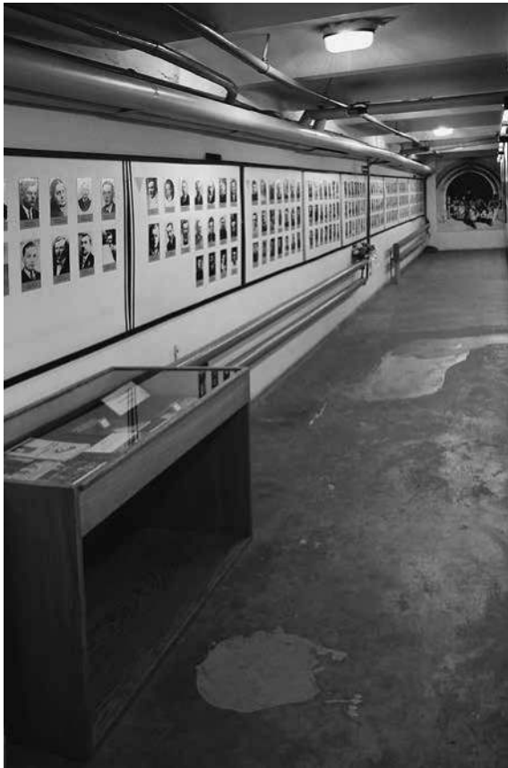
Abb. 13: Der rechte Zellengang des Martyrologiemuseums »Unter der Uhr«.

von Ausstellungstafeln, die primär mittels großformatiger Kuratortexte die Ereignisgeschichte skizzieren (siehe Abb. 12). Ein weiteres zentrales Element der Schau sind Namenslisten sowie eine Porträtgalerie von in Konzentrationslager deportierten und ermordeten Häftlingen des Lubliner Schlosses (siehe Abb. 13). Die Präsentation besteht in ihren wesentlichen Elementen bis in die Gegenwart. 161 Einzelne thematische Ergänzungen und Verände-