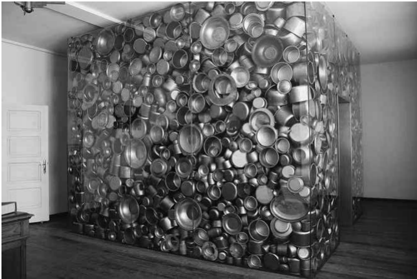
Abb. 21: Schindler-Fabrik, Installation in »Schindlers Büro«.

Wände mit den Namen der von Schindler Geretteten beschrieben sind; diese Namen werden von einer Stimme aus dem Off vorgelesen. Hinter der Installation werden in zwei Videostationen Interviews mit Überlebenden der Liste gezeigt. Das Objekt, das von den Ausstellungsverantwortlichen »Arche« genannt wird, 116 stellt damit die Personen in den Mittelpunkt, die von Schindler gerettet wurden. Die Überlebenden stehen somit in diesem Raum im Zentrum der Aufmerksamkeit, weniger die Person Oskar Schindlers, auch wenn durch die Verortung der Installation in seinem Büro seine entscheidende Rolle bei diesem Prozess deutlich wird. 117 Diese exponierte Darstellung seiner Figur innerhalb der Ausstellung ist eine Referenz an ihren konkreten Ort,