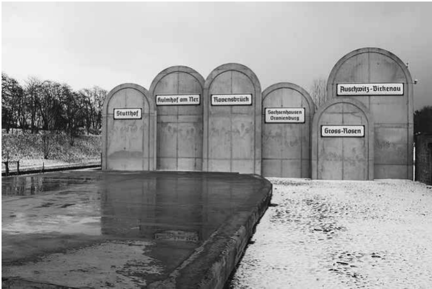
Abb. 29: Station Radegast, symbolische Grabsteine am Ende des Bahnsteigs.