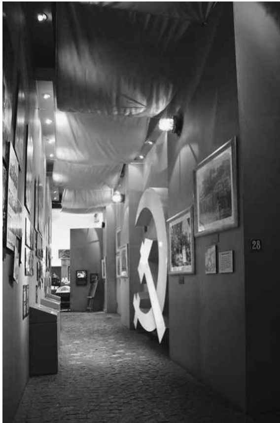
Abb. 22: MPW, Sektion »Das Lubliner Polen«.

So findet sie etwa Anwendung bei der Darstellung des Schauprozesses gegen führende Vertreter der polnischen Widerstandsbewegung in Moskau im Juni 1945. 240 Eine stark vergrößerte Liste der Namen von verfolgten Widerstandskämpfern ist in roter Farbe gehalten ebenso wie ein Foto vom Prozess, das den Hintergrund der Ausstellungstafel bildet. In ihrem Zentrum prangt zudem ein roter Stern – Symbol sowohl für das kommunistische Regime im Nachkriegspolen als auch für die Dominanz der Sowjetunion im Land. 241