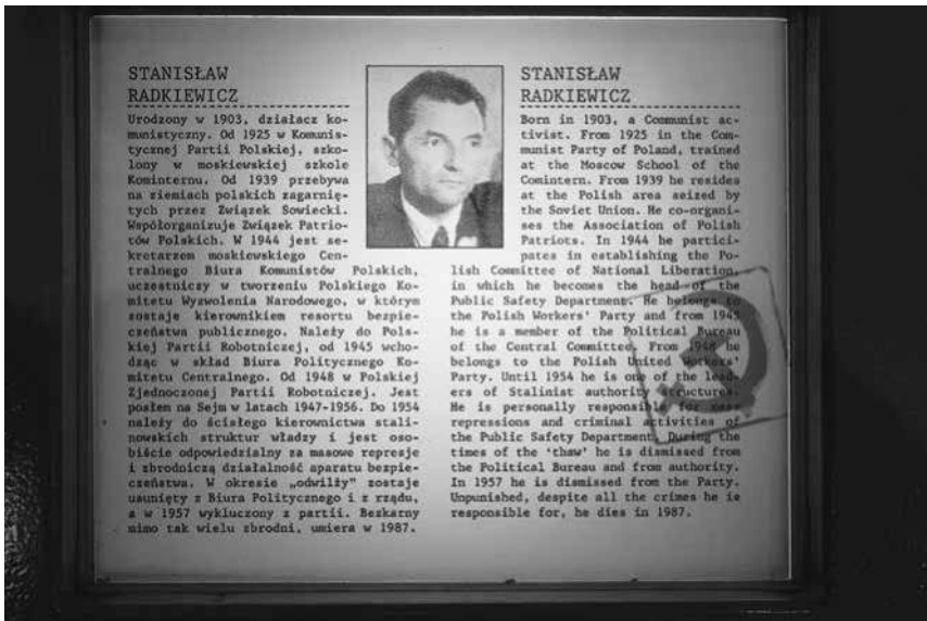
Abb. 23: MPW, Sektion »Das Lubliner Polen«, Biogramm von Stanisław Radkiewicz, der in den Jahren 1945 bis 1954 Minister für Öffentliche Sicherheit der VRP war.

tiv bewerteten politischen Nachkriegsentwicklung Polens, also der Etablierung der Volksrepublik unter sowjetischer Vorherrschaft. Dies zeigt sich etwa in der konsequenten Verwendung des Terminus »Befreiung« ausnahmslos in Führungszeichen, welche die Zweifelhaftigkeit der Anwendbarkeit des Begriffs für das polnische Nachkriegsschicksal suggestiv vermittelt. 242 In der Sektion zum »Lubliner Polen« wird diese Sichtweise offensiv und vielfältig transportiert: So schildert man etwa die Entstehung der Ämter für Öffentliche Sicherheit im neuen Polen unter dem aussagekräftigen Titel »Der Beginn des Kampfes mit der Freiheit«. An anderer Stelle findet sich eine Gegenüber- bzw. Nebeneinanderstellung eines Aufrufs polnischer Anhänger der Sowjetunion einerseits, in der die Rote Armee als Befreier von der deutschen Unterdrückung bezeichnet und die Bevölkerung dazu angehalten wird, diese nach Kräften zu unterstützen, mit einer Karikatur eines lachenden Stalins andererseits, der sich als Befreier bezeichnet – während er einer gefesselten Frau, die symbolisch für das polnische Volk steht, eine Klinge an den Hals legt. 243 Be-