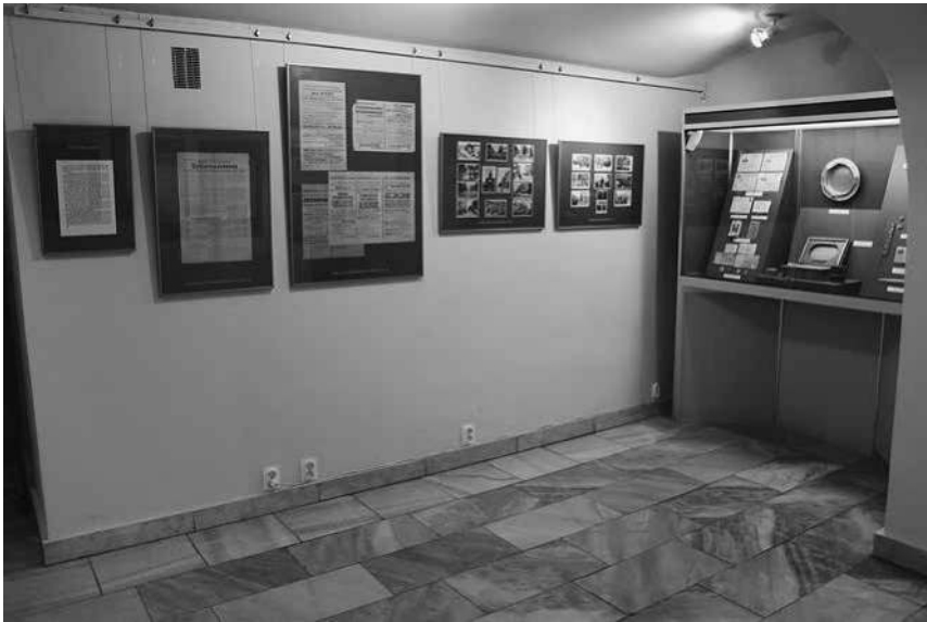
Abb. 6: Die Dauerausstellung »Łódźer Triade«, Sektion »Lodsch – Litzmannstadt«.

schaften. Polen – Deutsche – Juden) 120 und war bis Mitte 2015 121 zu besichtigen. Die Schau gliederte sich in drei chronologisch-thematische Sektionen, deren Themen- und Bereichstexte 122 jeweils eine eigene Farbcodierung aufwiesen. Die letzte Sektion mit einer Fläche von knapp 30 Quadratmetern war den Jahren des Zweiten Weltkriegs gewidmet. Die Darstellung erfolgte objektzentriert: Glasvitrinen und Bilderrahmen mit Fotografien und Dokumenten wurden von wenigen Kuratorentexten ergänzt (siehe Abb. 6). Das Museum