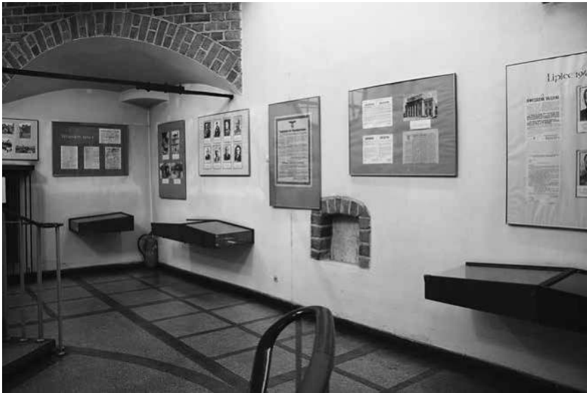
Abb. 11: Die Sektion zum Zweiten Weltkrieg im Krakauer Tor.

Stadtgeschichte von ihren Ursprüngen im 6. Jahrhundert bis zum Jahr 1944. Die erste ständige Präsentation bestand aus weißen Ausstellungstafeln mit großformatigen Faksimiles von Dokumenten und Fotografien. Abgesehen von einzelnen Überschriften fand sich nur auf einer Tafel der Sektion zum Zweiten Weltkrieg ein längerer Kuratorentext, der sich dem Widerstand in den Jahren 1939 bis 1944 widmete (siehe Abb. 11). 157 Wenige dreidimensionale Exponate waren und sind in einzelnen Vitrinen untergebracht. Die aktuelle Dauerausstellung folgt einem ähnlichen Prinzip. 158 Es dominieren Fotografien sowie Kopien von Zeitungsberichten und Dokumenten, die schlaglichtartig zentrale Ereignisse und Protagonisten der Kriegs- und Besatzungsjahre der Stadt vorstellen. Die Porträtfotografien einzelner politischer und militärischer Protagonisten sind mit kurzen biografischen Informationen versehen. Umfangreichere Kuratorentexte finden sich in dieser Schau nun dagegen nicht mehr. Zwischen 2008 und 2011 bewegte sich die jährliche Besucherzahl der Ausstellung im Bereich zwischen ca. 4.000 und 4.400 Personen. 159