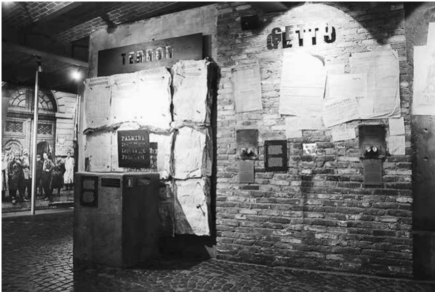
Abb. 26: MPW, Abschnitte »Terror« und »Ghetto«.

Besatzungsorgane illustriert, auf denen Namenslisten von zum Tode Verurteilten und Exekutierten abgedruckt sind. Stellvertretend für die Massenerschießungen steht auch der Begriff »Palmiry«, der prominent platziert ist: Der Name dieses Waldgebietes bei Warschau ist in der kollektiven Erinnerung gerade der Warschauer Bevölkerung mit den deutschen Massenerschießungen von Zivilisten, aber auch von bedeutenden Politikern und Kulturschaffenden assoziiert. Diese Deutung wird auch in der Schau unmissverständlich vermittelt, durch den Schriftzug »Palmiry/20–21.VI.1940/Mord an 358/Polen«. Die Plakate wiederum sind in großer Zahl übereinander geklebt, sodass sie dicke Bündel bilden, die eine hohe Zahl an Todesopfern suggerieren. 210 Die wenigen, einzeln angebrachten Bekanntmachungen in der Sektion »Ghetto« unmittelbar daneben wirken demgegenüber deutlich weniger bedrohlich. Zusätzlich wird der erstgenannte Abschnitt rot angeleuchtet; die Papierstapel sind an den Rändern mit roter Farbe versehen, die angesichts des Themas eine unmittelbare Assoziation mit dem Blut der Opfer hervorruft, und auch der zentrale Schriftzug »Terror« ist blutrot beleuchtet – im Gegensatz zur Sektion »Ghetto«, die nicht mit einer ähnlich dramatischen Licht- und Farbgiege versehen wurde. Die Gestaltung dieser zwei direkt nebeneinander positionierten Sektionen legt damit den Schwerpunkt auf die Gewalt an ethnischen