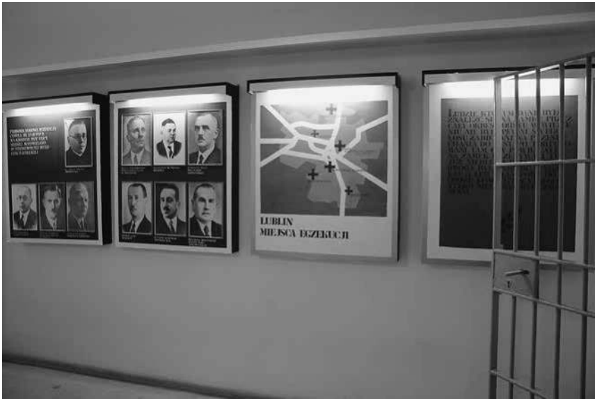
Abb. 12: Das Martyrologiemuseum »Unter der Uhr«, Blick in Zelle 9.