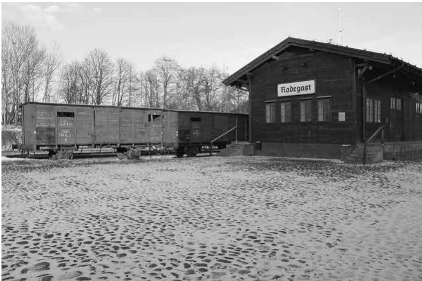
Abb. 28: Station Radegast, das erhaltene Stationsgebäude.