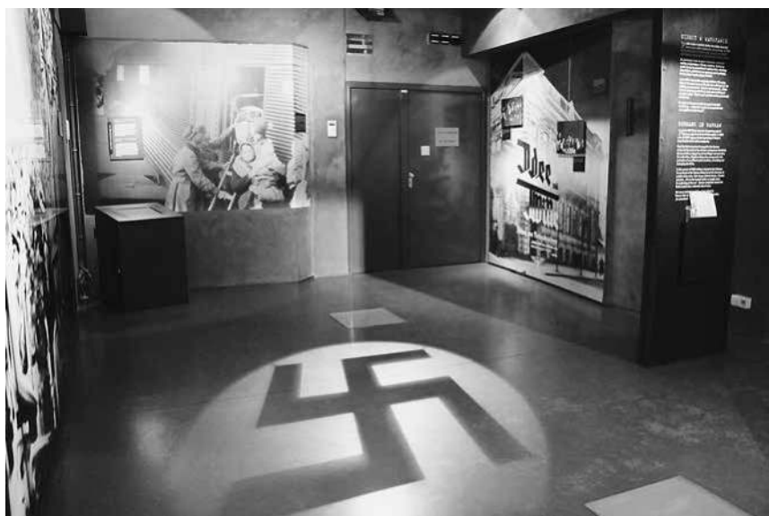
Abb. 15: MPW, Eingangsbereich der Sektion »Die Deutschen in Warschau«.