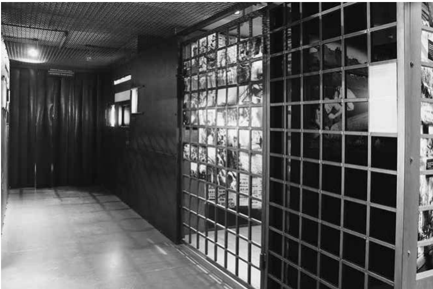
Abb. 16 und 17: MPW, Sektion »Die Deutschen in Warschau«.