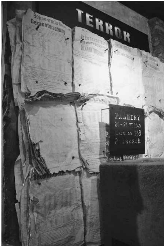
Abb. 40: MPW, Abschnitt »Terror«.

genz erschossen wurden. Die Buchstaben des Begriffs »Terror« leuchten rot; die Ränder der Plakate sind gleichfalls rot bemalt und rufen hierdurch Assoziationen mit dem Blut der Opfer hervor. 154 Das Leben und Sterben im Ghetto