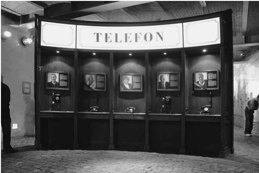
Abb. 47: MPW, Sektion »Der Aufstand nach 60 Jahren«.

Diese wird auch im weiteren Verlauf der Schau immer wieder vermittelt. Unmittelbar nach der beschriebenen Sektion treffen die Besucher auf eine weitere Installation, einen metallenen Quader. 322 Seine Oberfläche ist mit den Daten der 63 Tage des Aufstandes sowie mit dem bekannten Anker als Zeichen des »Kämpfenden Polens«, versehen (siehe Abb. 48 und 49). 323 Aus