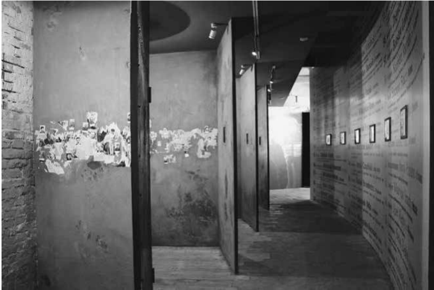
Abb. 19: Schindler-Fabrik, Sektion »Terror«.

gestalterische Verbindung dieser zwei Gesichter der Besatzungsmacht stellt eine Litfasssäule her, die mit Plakaten beklebt ist, die Konzerte, Ausstellungen und politische Großveranstaltungen in deutscher Sprache ankündigen. Die Säule steht symbolisch auf der Grenze zwischen den beiden Seiten der Besatzungsrealität; sie reicht je zur Hälfte in beide Sektionen hinein, wodurch die schwarz-weiße, abstrakte Welt der Besatzer mit der farbigen, damit sinnbildlich realen Erfahrungswelt der Besetzten in Verbindung gebracht wird (siehe Abb. 20).