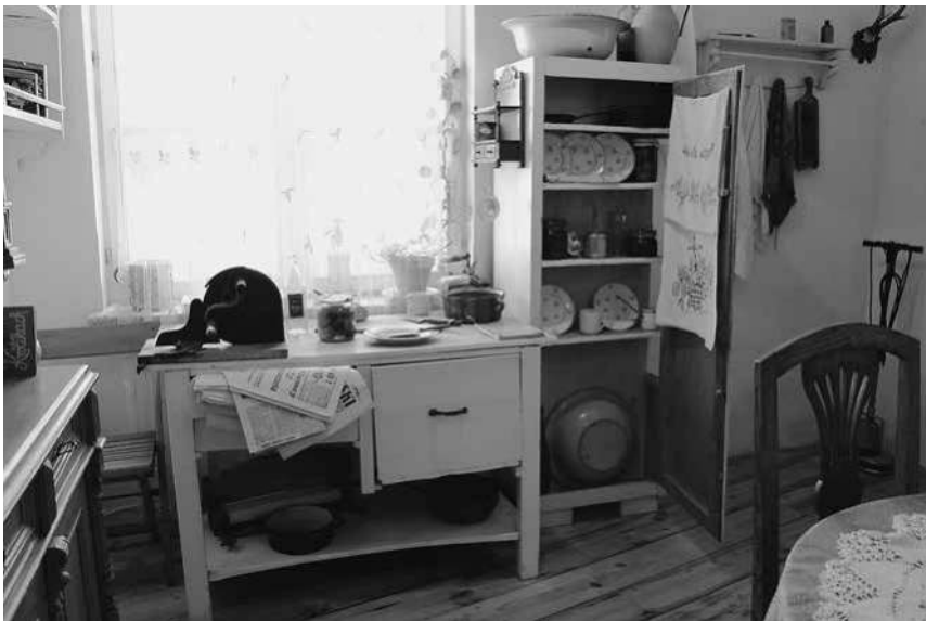
Abb. 44: Schindler-Fabrik, Küche in der Sektion »Polnischer Untergrundstaat«.