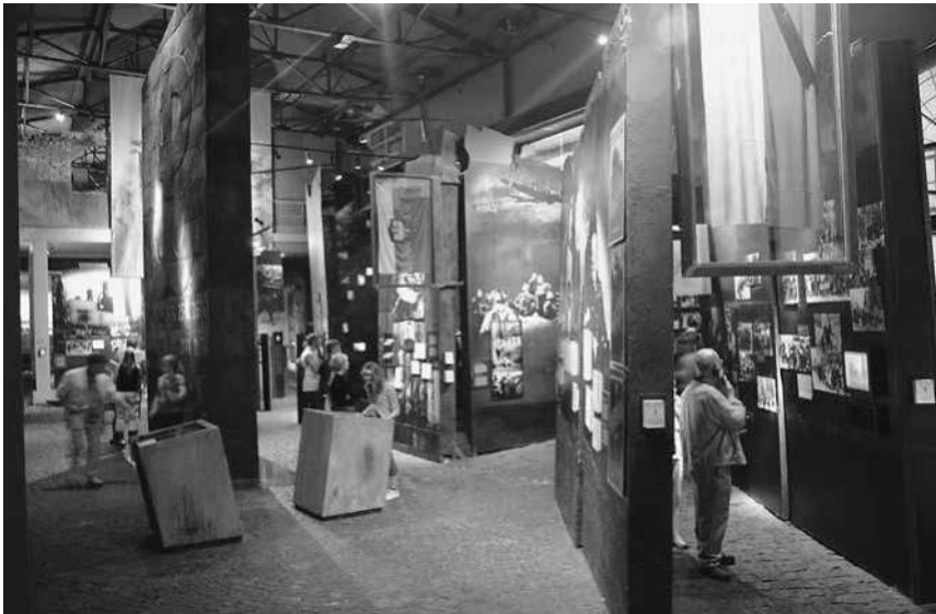
Abb. 4: Das Museum des Warschauer Aufstands, Blick in die erste Etage.

Thematischer Schwerpunkt der Dauerausstellung sind die Ereignisse während der 63 Tage des Aufstands der polnischen Heimatarmee gegen die deutschen Besatzer vom 1. August bis zum 2. Oktober 1944. Sie umfasst jedoch darüber hinaus den Zeitraum vom Kriegsausbruch 1939 bis zu den Prozessen gegen führende Vertreter des polnischen Untergrundstaates und Mitglieder der Heimatarmee in der Volksrepublik Polen bis Mitte der 1950er-Jahre. Die 3.000 Quadratmeter große Schau ist chronologisch gegliedert; der Rundgang ist zusätzlich um einzelne Themenräume ergänzt. Als erste ihrer Art in Polen setzte sie auf umfangreiche Inszenierungen und Szenografien, die den Besuchern den Eindruck vermitteln, die Welt der kämpfenden Stadt zu betreten (siehe Abb. 4). Das Außengelände des Museums wurde zudem mit zahlreichen Denkmälern und Gedenktafeln ausgestattet, die den Anspruch der Museumsverantwortlichen dokumentieren, ihre Institution als zentralen Informations- und Gedenkort für den Warschauer Aufstand und die gefallenen Kämpfer zu etablieren. 111 Das MPW ist eines der beliebtesten Museen der Stadt; in den Jahren 2008 bis 2013 bewegte sich seine jährliche Besucherzahl zwischen annähernd 420.000 und 525.000. 112