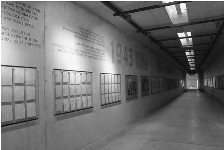
Abb. 27: Station Radegast, die Ausstellung im »Tunnel der Deportierten«.