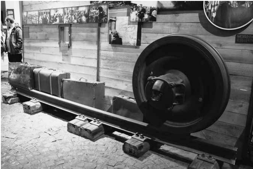
Abb. 38: MPW, Sektion »Exodus«.

des Jahres 1944 in den östlichen Gebieten des besetzten Polens vermittelt – es geht um den heldenhaften, jedoch verlustreichen Kampf für die Unabhängigkeit des Landes. Auch inhaltlich gibt es zahlreiche Verweise auf Religiosität und Religionsvertreter, die während des Aufstands aktiv waren. Als zum Alltag während der Kämpfe gehörendes Element werden etwa die Gottesdienste und Kapellen in Hinterhöfen und Kellern thematisiert. Stellvertretend für diesen Teil des »Alltags« stellt man Priester namentlich und mit Fotografien vor, die einzelne Verbände der Aufständischen betreuten. 126 Besonders herausgehoben wird der Priester Józef Stanek, der Aufständischen wie Zivilisten während der Kämpfe aufopferungsvoll geholfen habe. 127 Betont wird