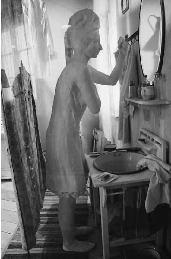
Abb. 46: Schindler-Fabrik, arrangierte Szene in der Sektion »Ghetto«.

Das Anliegen der Ausstellungsmacher war es, den Besuchern einen Einblick in die historischen Ereignisse aus der Perspektive der (damaligen) Einwohner Krakaus zu ermöglichen; Ziel war es, eine »emotionale Geschichte der Stadt« zu präsentieren. 305 Es ist daher davon auszugehen, dass durch die inszenierte Ghettowohnung bei den Besuchern Empathie geweckt werden sollte mit den Leidtragenden dieser unmenschlichen Bedingungen. Bemerkens-