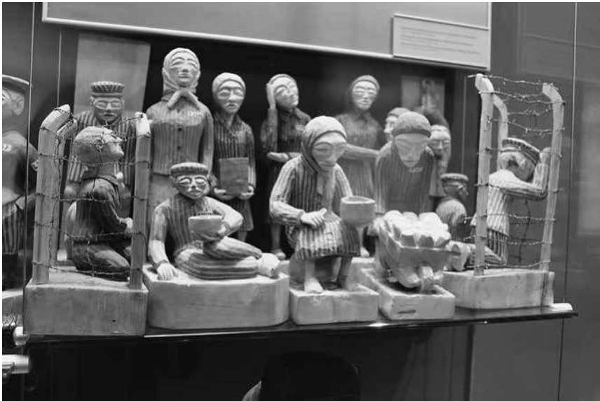
Abb. 42: Historisches Museum in Wrocław, Exponat im Saal »Die hitleristische Diktatur – Der Zweite Weltkrieg«.

kerungszahl. 176 Im Laufe des Kriegs kamen jedoch Zehntausende Polen als Zwangsarbeiter in die Stadt oder wurden in naheliegenden Konzentrationslagern interniert. 177 Bemerkenswert ist, dass in der musealen Präsentation vollkommen vernachlässigt wird, dass neben Polen auch Menschen aus zahlreichen weiteren Ländern in den Lagern inhaftiert waren. 178 Wie Norman Davies und Roger Moorhouse schildern: