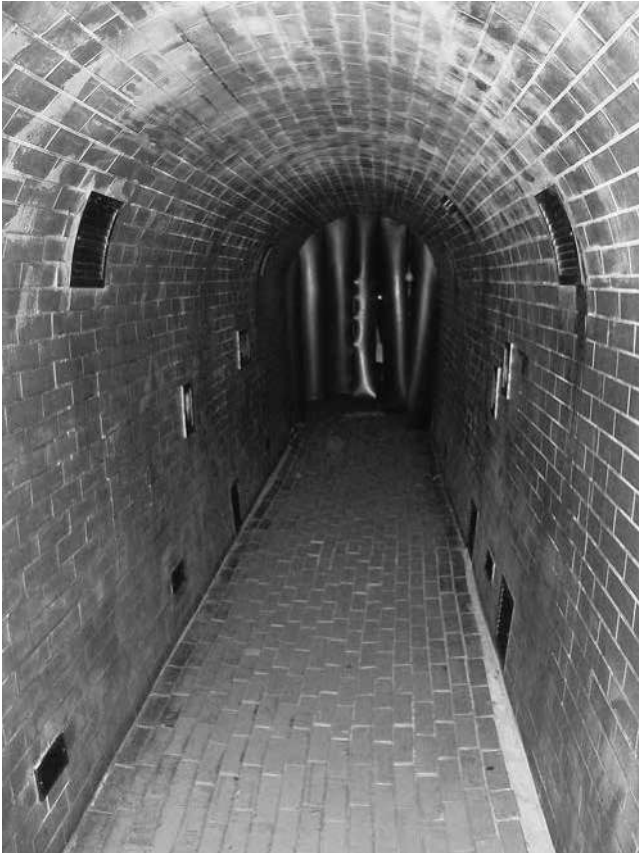
Abb. 50: MPW, Sektion »Kanal«.

verschlossenen Gitter ankommen (und damit ihrem Todesurteil begegnen), wird im Museum ein positiver Ausblick angeboten: Als Zeichen der Hoffnung sind mehrere Gitterstäbe durchbrochen. Im Keller des Museums findet sich schließlich ein in originalen Abmessungen nachgebauter Kanalisationskanal. 339 Durch diesen können sich die Besucher zwängen und selbst die Dunkelheit und Enge erfahren, 340 die die Aufständischen ertragen mussten – ein beliebter Spaß gerade bei Schülergruppen, auch wenn die suggerierte Authentizität selbstverständlich illusorisch ist; man bedenke allein die realen Bedingungen