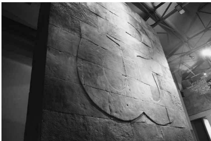
Abb. 49: MPW, das »Monument« in der ersten Etage.