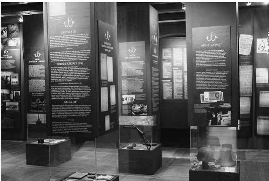
Abb. 2: Abschnitt »Der Polnische Untergrundstaat – Die Widerstandsbewegung in Warschau 1939–1944« in der Schau des MHW.