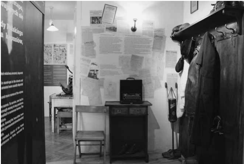
Abb. 43: Schindler-Fabrik, inszenierter Flur in der Sektion »Polnischer Untergrundstaat«.