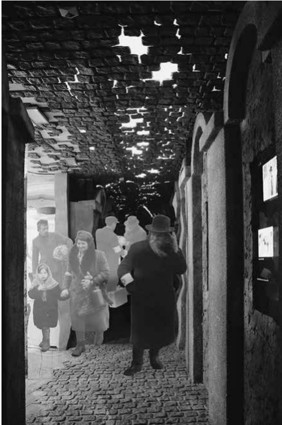
Abb. 32: Schindler-Fabrik, Spiegelwand in der Sektion »Ghetto«.

Die Liquidierung des Ghettos zwei Jahre später wird in einem ähnlich gestalteten schmalen schwarzen Gang erzählt, der von einer Seite wiederum von der Ghettomauer begrenzt wird. 399 Am Ende des langen Ganges deutet die rote Einfärbung einer auf Raumhöhe vergrößerten Fotografie die Brutalität und Gewalt der Deportationen an, welche die entlang des Ganges angebrachten kleinen sepiafarbenen Fotografien der Kolonnen von Menschen nur zum Teil wiedergeben. Am Ende des Ganges trifft man auf einen Haufen aus Möbelstücken und Matratzen, die für das zurückgelassene Hab und Gut der Deportierten und damit auch sinnbildlich für deren Abwesenheit stehen. Im Hintergrund sind furchteinflößendes Hundegebell sowie die bedrohlichen