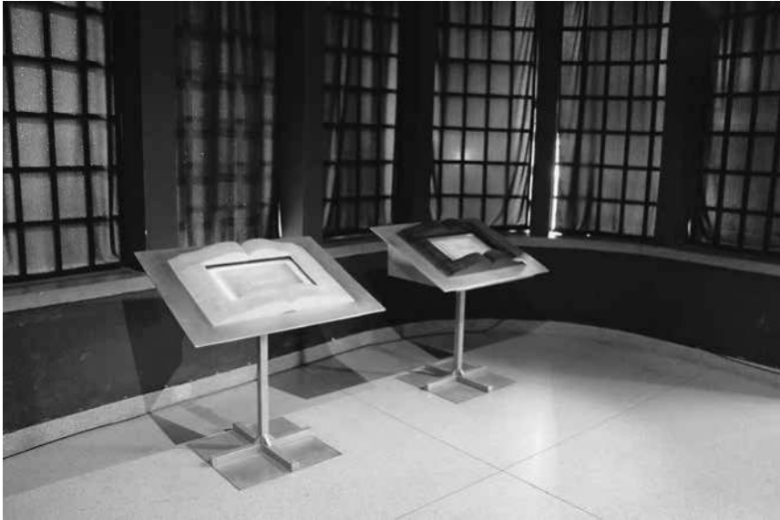
Abb. 35: Schindler-Fabrik, »Saal der Entscheidungen«, zweiter Teil.

schen Vorgabe sich selbst eingestehen wird, dass sie oder er zu den »Verbrechern« 417 gehört hätte? Diese Installation konterkariert somit paradoxerweise die bis dahin dominierende multiperspektivische Erzählweise der Ausstellung, in der immer wieder ambivalentes Handeln gezeigt wird, das nicht unbedingt eindeutige Einteilungen in Schwarz und Weiß erlaubt, sondern die vielen Graustufen des Besatzungsalltags offenbart. Den Besuchern wird letztlich im »Saal der Entscheidungen« die Bewertung der historischen Ereignisse innerhalb eines universellen moralischen Kanons vorgegeben. Diese normative Bevormundung ist auch einer der bislang größten Kritikpunkte der Schau. 418