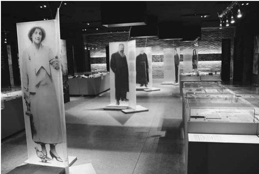
Abb. 37: Gefängnismuseum Pawiak, fünf Persönlichkeiten »begegnen« den Besuchern in der Mitte des Ausstellungssaals.

Noch bevor die Besucher die Informationen zu den einzelnen Individuen jedoch lesen können, wird durch diese Elemente bereits vorgegeben, dass es sich um Menschen handelt, die das Leitmotiv der Schau lebten und dafür starben, sie daher als Helden und Märtyrer zu erinnern sind. Die Gestaltung der Objektträger verleiht den fünf Einzelpersonen somit eine sakrale, Ehrfurcht gebietende Aura.