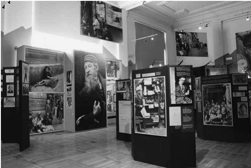
Abb. 5: Die Dauerausstellung des Jüdischen Historischen Instituts namens Emanuel Ringelblum.

Ghettos »Oneg Schabbat« (siehe Abb. 5). Die Schau bestand bis Dezember 2012. In diesem Jahr hatte sie ca. 11.500 Besucher. 117