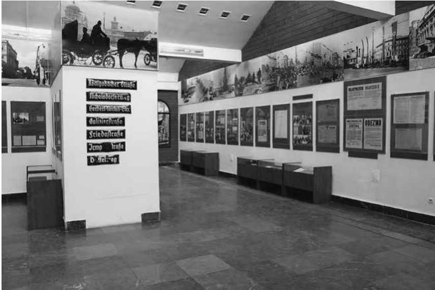
Abb. 7: Die Dauerausstellung »Łódź und die Łódźer Region in den Jahren des Kriegs und der Besatzung 1939–1945«.

rücksichtigt werden können. 128 Eine neukonzipierte Schau aus dem Jahr 2003 eröffnete schließlich unter dem Titel »Łódź i ziemia łódzka w latach wojny i okupacji 1939–1945« (Łódź und die Łódźer Region in den Jahren des Kriegs und der Besatzung 1939–1945); ihre Fläche gehörte mit 570 Quadratmetern zu den größten hier untersuchten thematischen Schauen aus diesem Zeitraum. 129 Sie stellte in einzelnen thematischen Sektionen, die weitgehend chronologisch gegliedert waren, die Geschichte der Stadt und Region vom Sommer 1939 bis zum Abzug der deutschen Truppen aus Łódź am 18. Januar 1945 dar. Es dominierten einfache Bilderrahmen mit Kuratortexten, Fotografien sowie reproduzierten Karten und Dokumenten. Vitrinen mit originalen Exponaten ergänzten den Rundgang. Oberhalb der Bilderrahmen waren großformatige Fotografien angebracht, die die jeweiligen thematischen Ab-