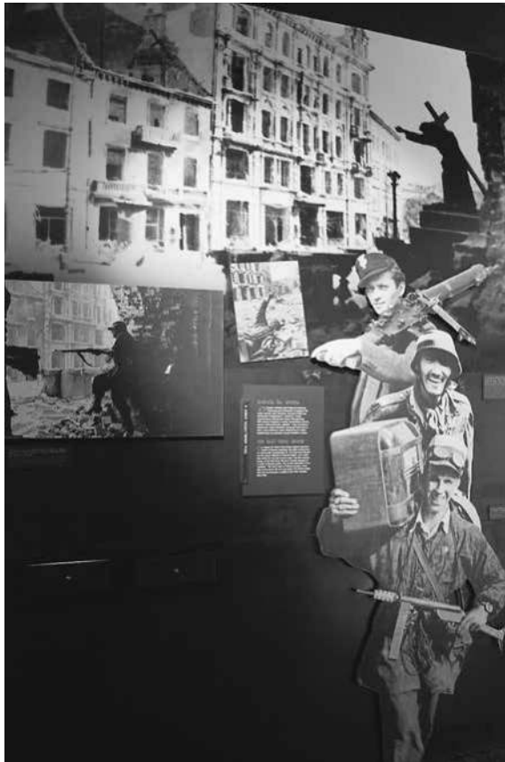
Abb. 53: MPW, Sektion »Die Kämpfe im August«.

scheinung treten, handelt es sich dagegen fast ausschließlich um Mitglieder der Untergrund- und Widerstandsorganisationen. Sie stehen stellvertretend für die Warschauer Gesamtbevölkerung.