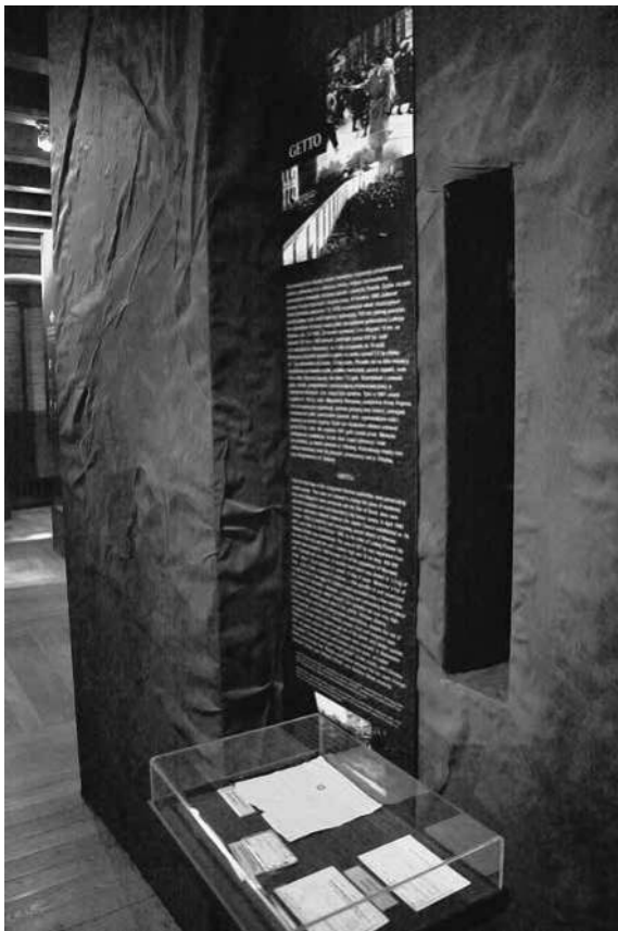
Abb. 24: MHW, Abschnitt »Das Warschauer Ghetto«.

Das Ghetto wird im MPW daneben auch in dem 2007 eröffneten Ausstellungsteil über »Die Deutschen in Warschau« thematisiert. 178 Dort werden in erster Linie Fotografien von Exekutionen, Demütigungen orthodoxer Juden und der Niederschlagung des Aufstands gezeigt sowie Filmmaterial über das Leben im Ghetto, das aus deutschen Propagandaufnahmen stammt. Auch im MHW handelte es sich bei den Fotografien, die den Themenbereich illustrierten und das Ghetto betrafen (bzw. überwiegend die Niederschlagung des Aufstandes), um deutsche Quellen. 179 Der Blick hinter die Mauer erfolgt somit