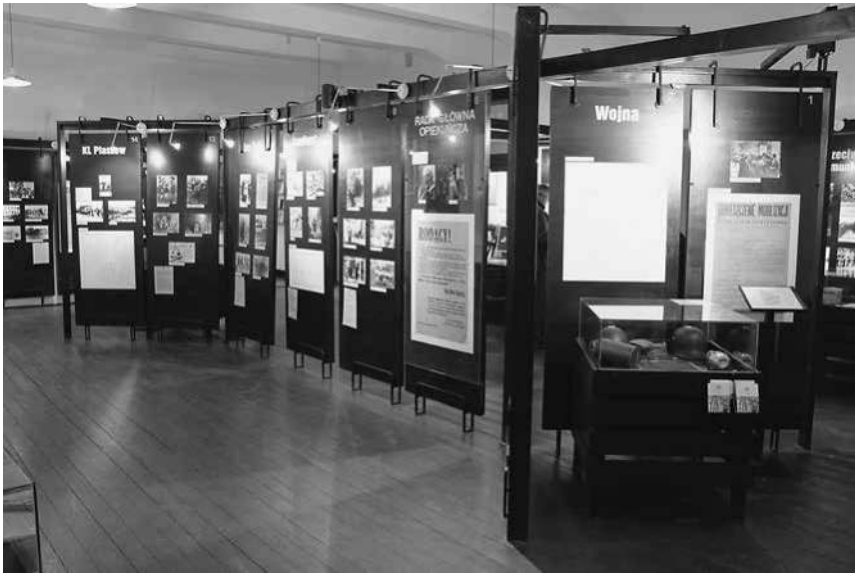
Abb. 8: Die Dauerausstellung »Kraków 1939–1956« in der Pomorska-Straße.

sowie verschiedene Musealien. Alle Präsentationen waren objektzentriert und die einzelnen thematischen Sektionen durch grafisch exponierte Überschriften markiert; Bildunterschriften und erläuternde Texte wurden nur sehr sparsam eingesetzt (siehe Abb. 8). 140 Die Besucherzahlen waren vergleichsweise gering, was auch mit der weiten Entfernung des Museums vom Stadtzentrum verbunden ist; im Jahr 2009 hatte die Abteilung knapp 8.500 Besucher. 141