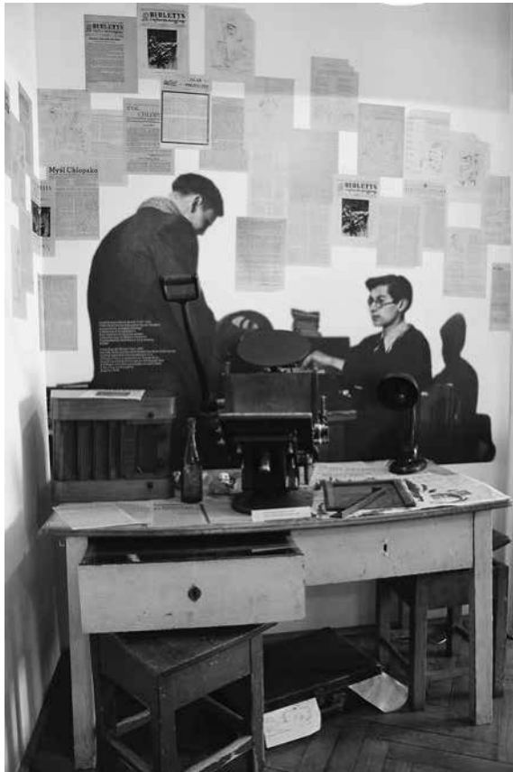
Abb. 45: Schindler-Fabrik, konspirative Druckerei in der Sektion »Polnischer Untergrundstaat«.

jüdischen und polnischen Stadtbewohner. Insbesondere die zweite Installation markiert jedoch suggestiv auch einen deutlichen Unterschied zwischen den beiden Gruppen: Die Ghettabewohner treffen die Besucher in Mitleid erweckender Enge und Unsicherheit an, noch dazu in sehr intimen Situationen – eine Frau etwa wäscht sich gerade (siehe Abb. 46). Die zusammengepflegte jüdische Bevölkerung erscheint somit im zentralen, da äußerst einprägsamen Element der Sektion in erster Linie als Leidende, als passive Opfer. Polen hingegen werden in der privaten Umgebung ihrer Wohnung als aktive Widerständige, mithin als Helden porträtiert. 304