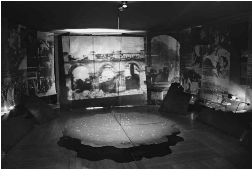
Abb. 41: MHW, Saal »Die Vernichtung Warschau – Die Vertreibung der Bevölkerung durch die deutschen Nazis. 1. August 1944–17. Januar 1945«.

einzelnen leuchtenden Punkten (siehe Abb. 41). Die Installation erinnerte an Grablichter, die traditionell auf polnischen Friedhöfen aufgestellt werden – eine Assoziation, die auch bewusst von den Ausstellungsverantwortlichen anvisiert wurde. 167 An der Stirnseite des Saales wurden Fotografien der zerstörten Stadt gezeigt. Den akustischen Hintergrund bildete das »Polnische Requiem« Krzysztof Pendereckis. Diese christliche Trauersymbolik wurde noch durch eine weitere Installation unterstützt: In regelmäßigen Abständen wurde der Raum verdunkelt, und es leuchteten nahe der Decke nacheinander die Nahaufnahmen dreier ungenannter Personen auf, zweier Frauen und eines Mannes. 168 Ihre erschöpften Gesichter, die im Dunkeln leuchteten, zudem die Haltung der einen Frau, die wie im Gebet versunken zu sein schien, erinnerten an christliche Märtyrerinszenierungen.