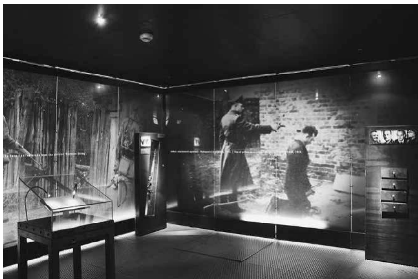
Abb. 14: MPW, Sektion »Die Deutschen«.