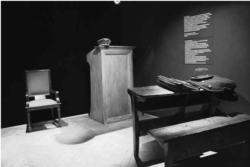
Abb. 9: Die Dauerausstellung in der Schindler-Fabrik, Sektion »Sonderaktion Krakau«.

Straße zog daraufhin eine neue Dauerausstellung ein, die sich auf die Darstellung des überwiegend gegen die polnische Bevölkerung Krakaus gerichteten Terrors in den Jahren 1939 bis 1956 konzentriert. Die Schau, die ebenso wie diejenige in der Schindler-Fabrik auf einer szenografischen, stark vom Theater geprägten Gestaltung basiert, wurde am 2. Juni 2011 eröffnet. 143 Sie wird in der vorliegenden Studie nicht mehr berücksichtigt.