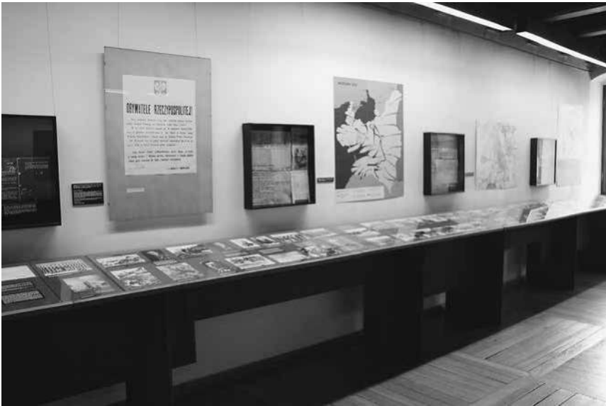
Abb. 1: Saal »Die Verteidigung Warschau im September 1939« in der Dauerausstellung des Historischen Museums der Hauptstadt Warschau.