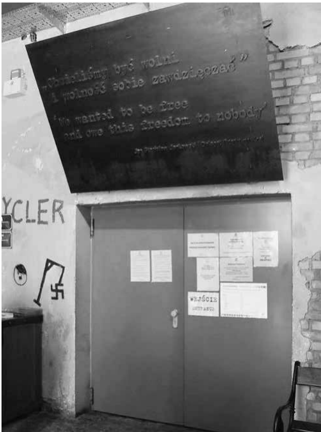
Abb. 51: MPW, Eingangsbereich des Museums.

jedoch an diesen Punkt der Ausstellung gelangen und die Möglichkeit haben, diese vereinzelte Information zu entdecken, wurden ihnen die Notwendigkeit und Unausweichlichkeit des Aufstands bereits mehrfach durch die beschriebenen Ausstellungselemente deutlich gemacht.