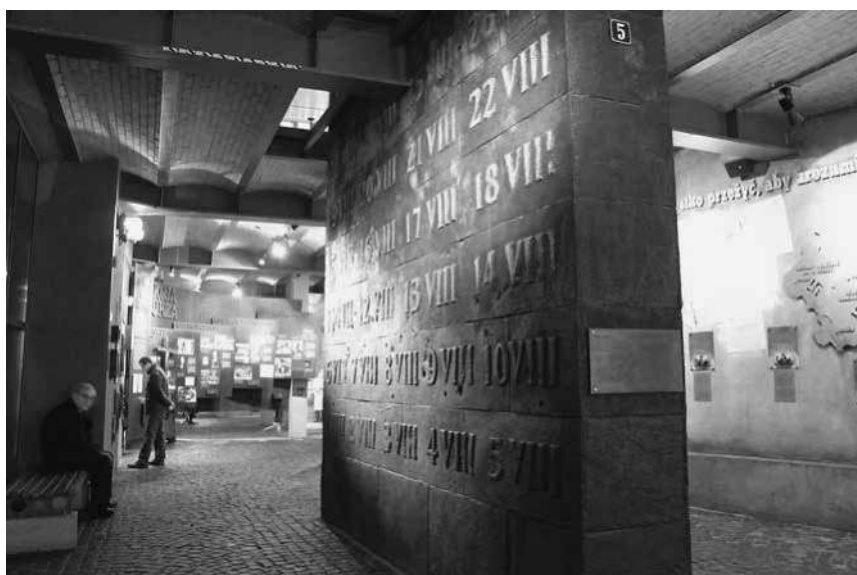
Abb. 48: MPW, das »Monument« im Erdgeschoss.