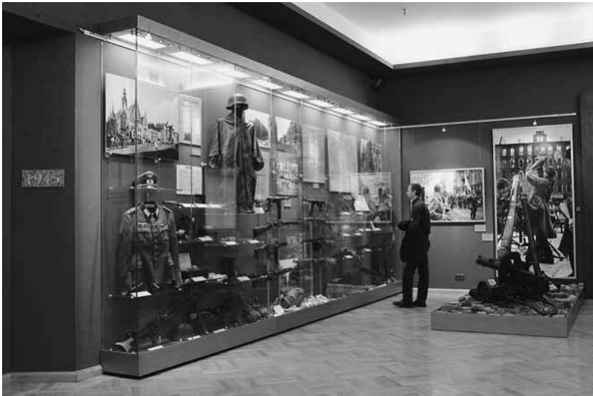
Abb. 10: Saal »Die hitleristische Diktatur – Der Zweite Weltkrieg« in der Dauerausstellung des Historischen Museums in Wrocław.

und auch in den einzelnen Ausstellungssälen auf kleinen Steinplaketten deutlich sichtbar finden. Polnische Besucher vermissen dort etwa oft das Jahr 1939, mithin den Kriegsausbruch; markiert sind dagegen der Beginn der NS-Herrschaft in Deutschland 1933 sowie das Jahr 1945, das Ende des Kriegs und der Übergang der Stadt an die Volksrepublik Polen. 149