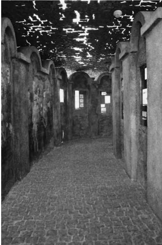
Abb. 31: Schindler-Fabrik, Sektion »Ghetto«.

die Pflastersteine, die nicht nur den Boden bedecken, sondern scheinbar auch die Decke bzw. den Himmel und dadurch das Gefühl hervorrufen, lebendig begraben zu sein (siehe Abb. 31). In eine der Ausstellungswände ist ein Spiegel integriert; unversehens erblicken die Besucher sich selbst zwischen lebensgroßen Fotografien von Ghettobewohnern und sehen sich damit als Teilnehmer der Ereignisse, von denen sie im Laufe des Rundgangs erfahren (siehe Abb. 32). Unvermittelt betreten die Besucher dann überfüllte Wohnräume im Ghetto – sie laufen mitten durch ein mit Möbeln zugestelltes Zimmer, in dem weiße Plastiken an die Menschen erinnern, die in der Enge leben mussten (siehe Abb. 33) –, bevor sie wieder in den engen, dunklen Gang eintreten. Beim Durchschreiten des Zimmers hören sie Gesprächsfetzen von Bewohnern, die sich über Alltagsprobleme wie Lebensmittelpreise unterhalten und Gerüchte austauschen.