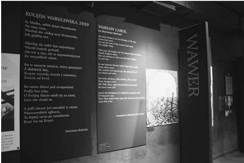
Abb. 36: Gefängnismuseum Pawiak, das Gedicht »Warschauer Weihnachtslied 1939« im ersten Teil des Ausstellungsrundgangs.

lungshalle angebracht sind. 68 Sie stechen sowohl durch ihre Schriftgröße heraus – die Gedichte nehmen fast die gesamte Raumhöhe ein – als auch durch ihre markante Farbgebung: Da die Hallenwände ebenso wie die Tafeln, auf denen die Gedichte abgedruckt wurden, dunkelgrau bis schwarz gestrichen sind, tritt die weiße Farbe der Schriftzeilen umso deutlicher hervor (siehe Abb. 36). Auch inhaltlich setzen die Gedichte markante Akzente. Sie sind jeweils thematischen Sektionen der Ausstellung zugeordnet – im ersten Teil beispielsweise dem Widerstand gegen den deutschen Angriff im September 1939, der folgenden Niederlage sowie der Darstellung des Terrorregimes der Besatzer – und kommentieren die dargestellten Ereignisse auf eindringliche und emotionale Art. Ein Großteil von ihnen recurriert auf christliche Motive und Ausdrucksformen. So verweist das erste Gedicht, das den Besuchern in der Ausstellung begegnet, »Święty Boże« (Heiliger Gott) von Kazimierz Wierzyński, 69 mit den Zeilen »Heiliger Gott, / Heiliger Starker, / Heili-