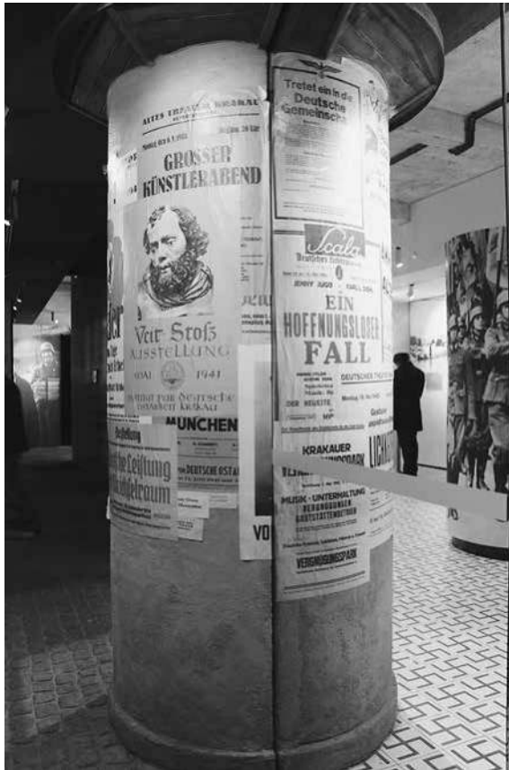
Abb. 20: Schindler-Fabrik, Sektion »Terror«.

gegnungsräume und alltägliche Kontakte zwischen deutschen und nichtdeutschen Einwohnern gleichwohl immer wieder aufgegriffen werden. So wird etwa bei der Darstellung des Alltags der Jahre 1940–1941 auf die Beteiligung der Wehrmacht am Schwarzmarkt verwiesen. 110 Im Weiteren sieht man unter anderem einen deutschen Offizier und eine junge Frau bei einer fröhlichen Kutschfahrt auf dem Marktplatz, daneben polnische Marktfrauen sowie Polen und Deutsche bei ihren Einkäufen. 111 Diese verschränkte Perspektive auf die Lebenswelten der drei größten Bevölkerungsgruppen Kra-