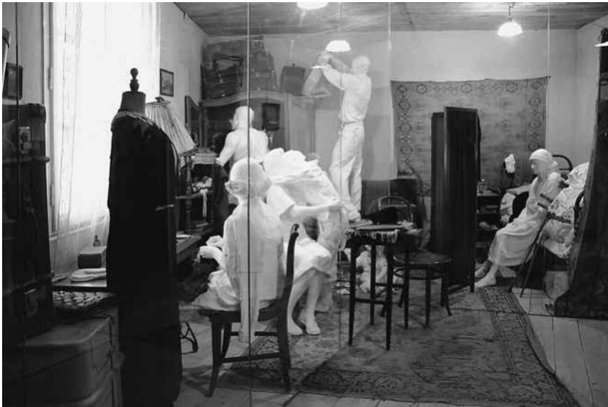
Abb. 33: Schindler-Fabrik, inszeniertes Zimmer in der Sektion »Ghetto«.

deutschen Rufe »Schneller, schneller! Raus!« zu hören. Im nächsten Moment betritt man bereits den Steinbruch des Konzentrationslagers Płaszów. 400 Als würden sie sich innerhalb eines Bühnenbildes bewegen, erlaufen die Besucher somit die einzelnen Stationen der Deportation. 401