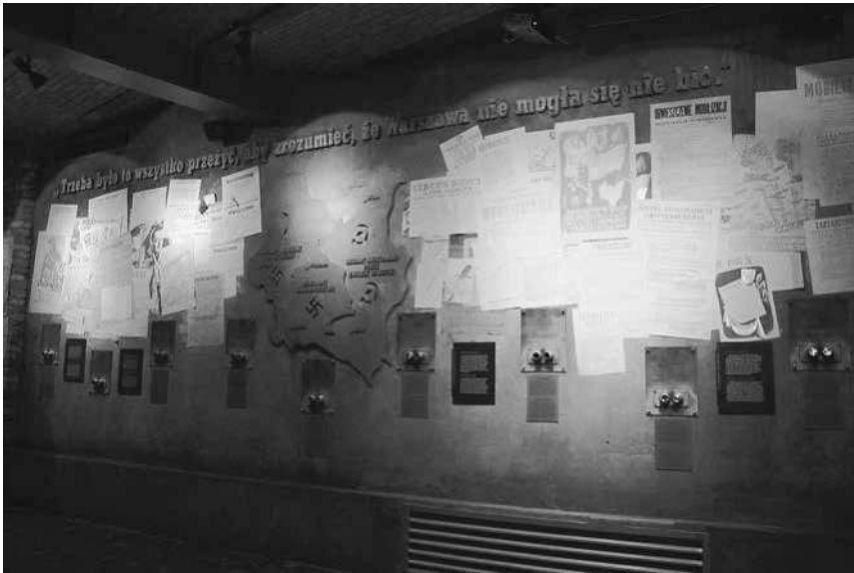
Abb. 52: MPW, Sektion »Besatzung«.

schwer abzubilden sei. 381 Angesichts der zahlreichen Argumente für den Aufstand, die in der Schau untergebracht worden sind, erscheint diese Argumentation jedoch wenig plausibel. Auch zeigt ein zeitgenössisches Beispiel aus Warschau, dass es sehr wohl Möglichkeiten gab und gibt, das schwierige Thema auch im Medium Ausstellung anzubringen. Im Haus der Begegnung mit der Geschichte ( Dom Spotkań z Historią ) wurde in den Jahren 2005/06 und 2009/10 die Ausstellung »Oblicza totalitaryzmu« (Gesichter des Totalitarismus) gezeigt. 382 In dieser war dem Warschauer Aufstand von 1944 eine eigene Sektion gewidmet. Verschiedene Aussagen und Bewertungen der Aufstandsfrage fanden sich dort nebeneinander gestellt; diese illustrierten äußerst gegensätzliche Einschätzungen: Direkt hinter dem Befehl Tadeusz Komorowskis vom 1. August 1944, der den Aufstand initiierte, ist die Reaktion General Władysław Anders' hierzu angeführt: »Ich persönlich halte die Entscheidung des Oberbefehlshabers der Heimatarmee für ein Unglück.« 383 Durch diese Kontrastierung von Positionen wurde den Besuchern vermittelt,