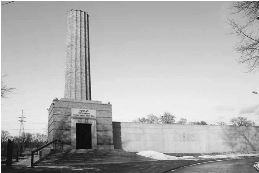
Abb. 30: Station Radegast, die »Halle der Städte« mit der »Säule der Erinnerung«.