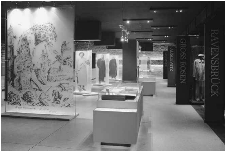
Abb. 3: Die aktuelle Dauerausstellung im großen Saal des Gefängnismuseums Pawiak.

einer umfassenden Erweiterung ihres thematischen Spektrums. 106 Berücksichtigt werden nun auch Kriegs- und Besatzungsereignisse auf gesamtstaatlicher Ebene mit einem Schwerpunkt auf den Ereignissen in Warschau, der Warschauer Region und im Generalgouvernement. Besondere Aufmerksamkeit erhalten die Reaktionen im westlichen Ausland auf die Situation im besetzten Polen. In den Jahren 2009 bis 2011 schwankte die jährliche Besucherzahl des Museums zwischen knapp 37.900 und 42.600 Personen. 107