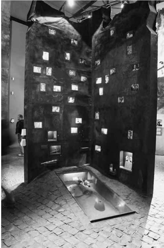
Abb. 39: MPW, Sektion »Gedenkort«.

bereitschaft der Aufständischen, der »jungen Patrioten« hingewiesen. 138 Die Gesamtinstallation ist für die Besucher damit deutlich als Ort identifizierbar, an dem des Märtyrertodes der jungen Aufständischen gedacht werden soll. Als »Gedenkort« ( miejsce pamięci ) ist sie auch explizit im Ausstellungsführer vermerkt. 139