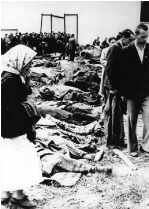
Figure 13 L'viv: Bodies of victims of the NKVD in the prison yard on Lonts'kyi Street (ulica Łackiego), July 1941

The photograph featured in Figure 12 appeared with the following captions: 'More Tears for Poland (As if She Hadn't Shed Enough Already!' According to the Nazi caption which accompanies this foto, it shows Ukrainian Poles as they searched through the welter of bodies Berlin says the Reds left just before they fled the city of Lwow. The girl seems overwhelmed, and the man at the left holds a handkerchief nervously to his nose. In the right background, another girl displays her piteous emotion' ( Daily News (New York City), 7 July 1941); 'Search for Massacre Victims. Ukrainians are shown hunting for identifiable victims after Russians killed 700 in Lwow, according to the caption prepared by the German censor. The Germans charged the OGPU, Soviet secret police, directed the massacre' ( New York