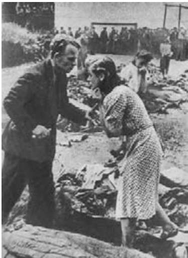
Figure 12 Inhabitants of L'viv among corpses trying to identify members of their families killed by the NKVD at the prison on Lonts'kyi Street (ulica Łackiego), July 1941

Ukrainian Museum, New York, 86/3356 [followed by textual comment entitled "Camera War"]