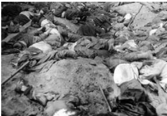
Figure 9 Bodies of prisoners killed by the NKVD in the Brygidki prison, July 1941

The same photograph under the archival signature 5138/98 carries the caption 'Bodies of Jews who were executed by firing-squad, June 1941.'