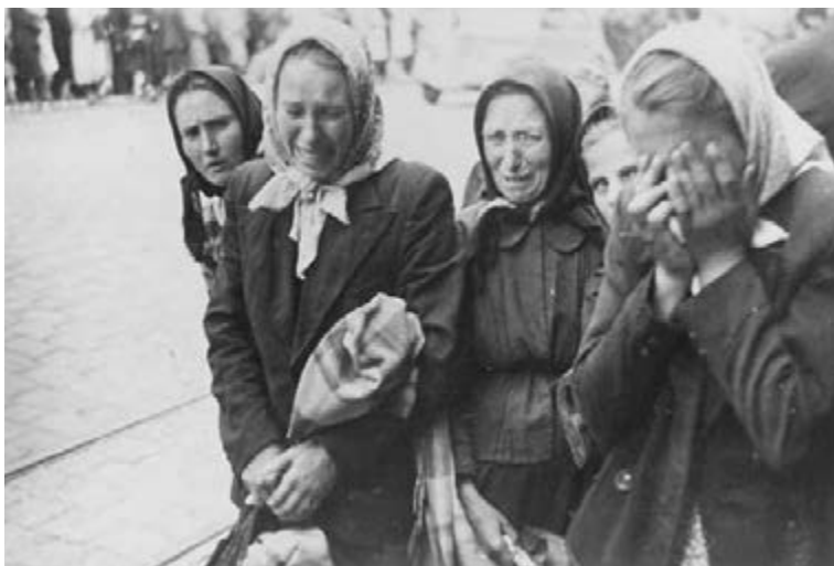
Figure 15 Prison on Zamarstyniv Street. Relatives of victims of the NKVD massacre at the prison on Zamarstyniv Street, July 1941