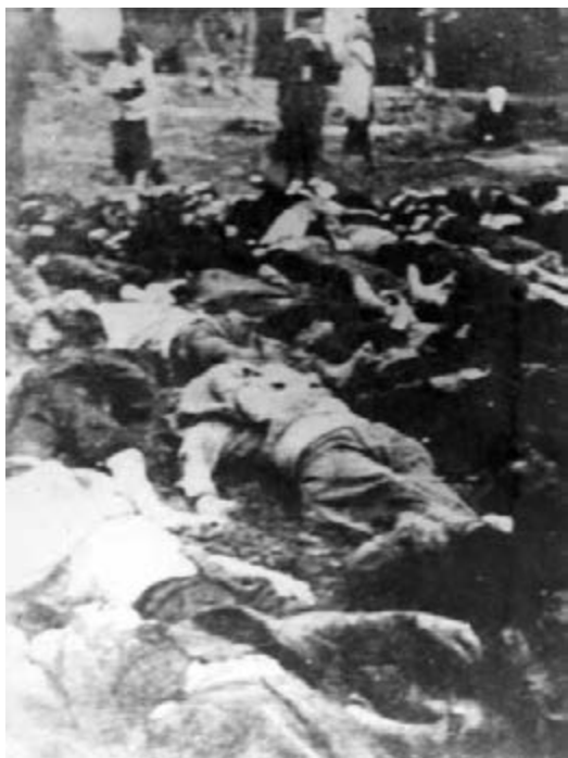
Figure 20 Bodies of prisoners killed by the NKVD in Boryslav, 1941