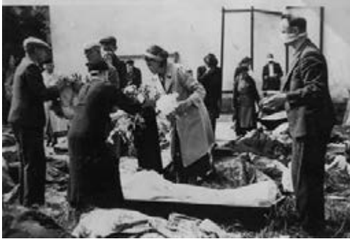
Figure 16 Exhumation and burial of victims of the NKVD massacre at the prison on Zamarstyniv Street, July 1941