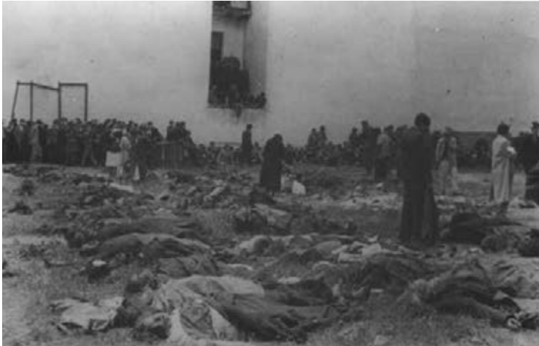
Figure 11 Local people looking for the bodies of their relatives in the yard of an NKVD prison on Lonts'kyi Street (ulica Łackiego), where the bodies were found, July 1941