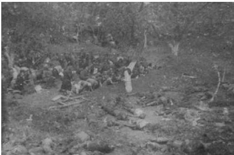
Figure 21 Exhumation of prisoners bodies who were murdered by the NKVD prior to the retreat of the Soviets from the area, summer of 1941