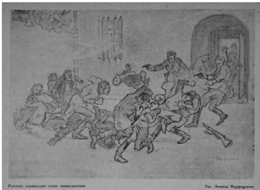
Figure 23 Leonid Perfets'kyi, 'The Execution of Ukrainian Peasants by NKVD Agents'