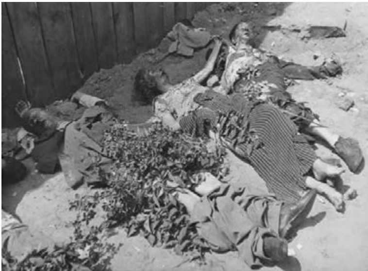
Figure 17 The corpses of individuals murdered by the NKVD in the courtyard of a L'viv city prison