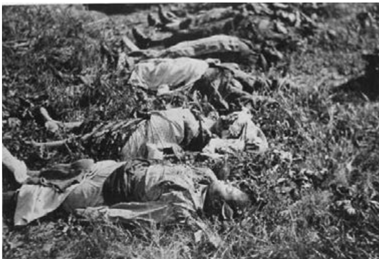
Figure 14 Victims of the NKVD massacre at the prison on Zamarstyniv Street, July 1941