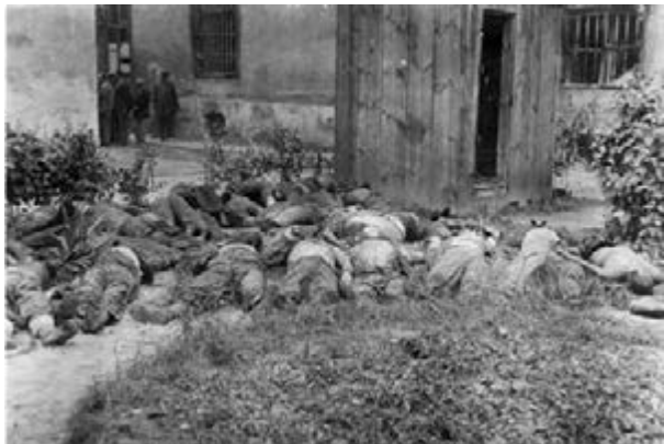
Figure 10 Bodies of prisoners killed by the Soviets before their retreat from the city, July 1941

Yad Vashem Photo Archive, 55A06. The same photograph under the archival signature 5138/98 carries the caption 'Bodies of Jews who were executed by firing-squad, June 1941.'