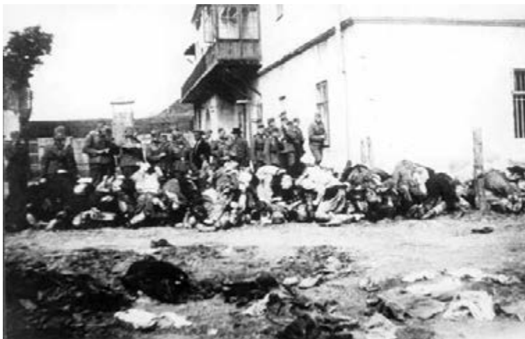
Figure 22 German soldiers looking at corpses of prisoners killed by the NKVD, July 1941