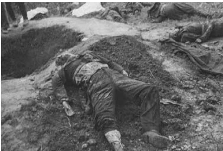
Figure 19 The corpses of prisoners executed by the NKVD at the prison in Bibrka, June 1941