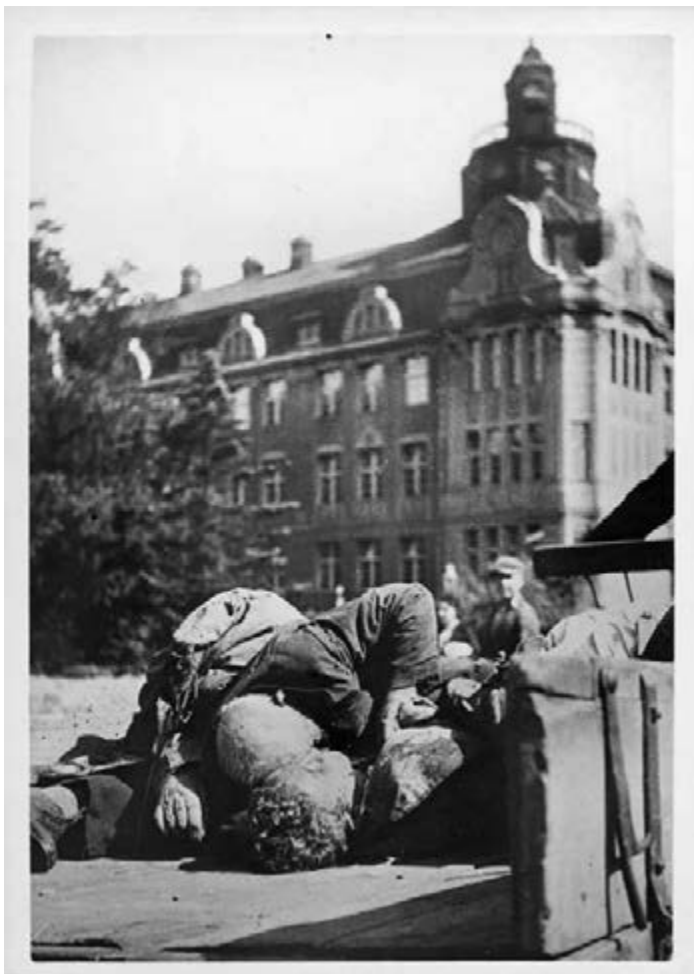
Alvin and Irene Steinkopf Papers, Wisconsin Historical Society 2