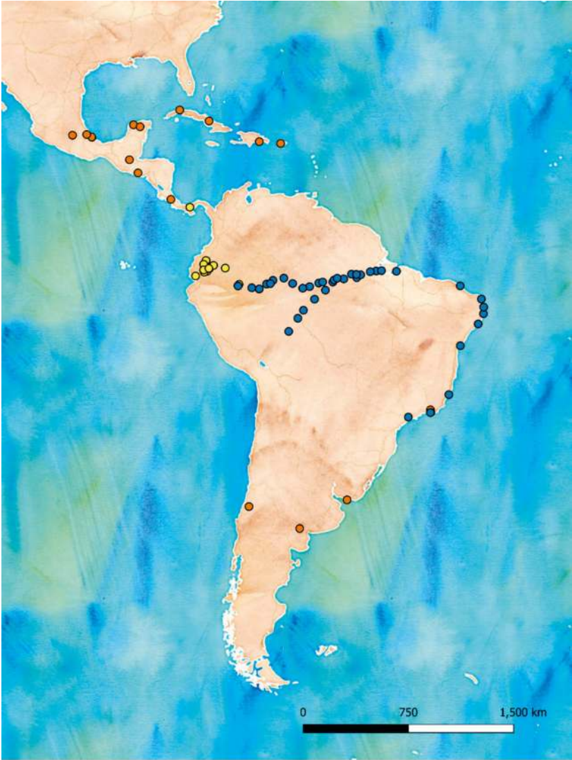
Abbildung 1: Reisewege der drei Autoren. Gabriela Mistral ● Mário de Andrade ● Henri Michaux ●