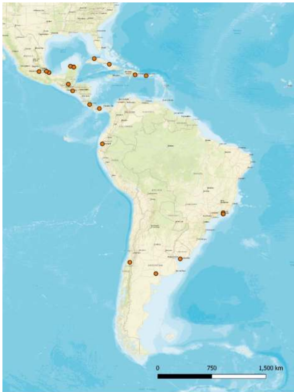
Abbildung 3: Reisewege Gabriela Mistral

Als 1889 im entlegenen chilenischen Valle de Elqui Lucila Godoy Alcayaga auf die Welt kam, ahnte niemand, dass sie als Gabriela Mistral zu einer der wichtigs-