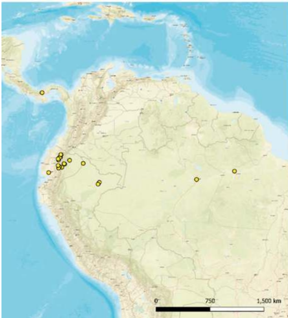
Abbildung 9: Reisewege Henri Michaux

Während Mistral und Andrade zu ihren Reisen aufbrachen, schiffte sich auf der anderen Seite des Atlantiks ein junger belgischer Künstler auf einem Dampfer Richtung Lateinamerika ein. Als er im Jahr 1927 in See stach, hatte der 28-jährige Michaux bereits ein abgebrochenes Medizinstudium sowie eine kurze Karriere als Matrose und einen längeren Aufenthalt in Paris hinter sich. 1 Im Umfeld