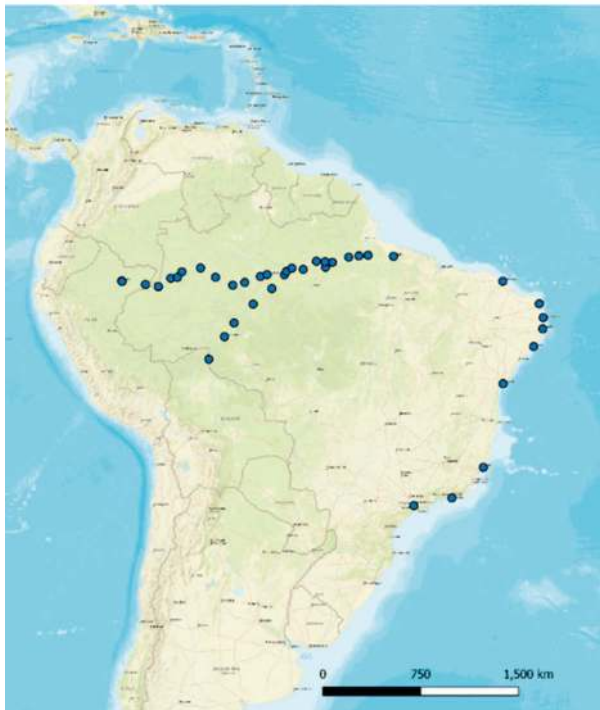
Abbildung 4: Reisewege Mário de Andrade

Bis zum Börsencrash im Jahr 1929 führte der Kaffeeboom in Brasilien zu einem rasanten Wirtschaftswachstum, das Migranten aus aller Welt in das Land zog – Schiffe aus Deutschland, Italien, dem zerfallenden Osmanischen Reich und Japan dockten in São Paulo an und ließen die vormals am Fluss Tietê von Jesuiten er-