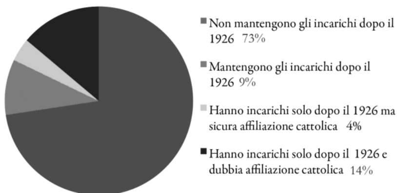
Grafico 1. I dirigenti delle associazioni cattoliche dopo l'avvento del fascismo

Di questi 70 personaggi infatti ben 36 sono difficilmente etichettabili come cattolici. Tra essi infatti si trovano numerosi nomi di esponenti fascisti, come ad esempio Giuseppe Stefenelli jr, segretario del Partito fascista trentino, o di altri politici dal passato liberale e nazionale. Purtroppo a questo punto della ricerca risulta ancora difficile poter definire in maniera precisa l'affiliazione di quasi la metà di questi personaggi. Specialmente quando si tratta di persone che hanno ricoperto un solo ruolo di consigliere all'interno di una delle istituzioni superstiti. Per molti di loro è difficile trovare una qualsiasi traccia, non essendo spesso nemmeno mai citati nelle opere secondarie specialistiche. Vista la scarsità di informazioni biografiche ad oggi disponibili sulla maggior parte dei 70 presi in considerazione, si è deciso di concentrare l'analisi sui vertici delle varie istituzioni.