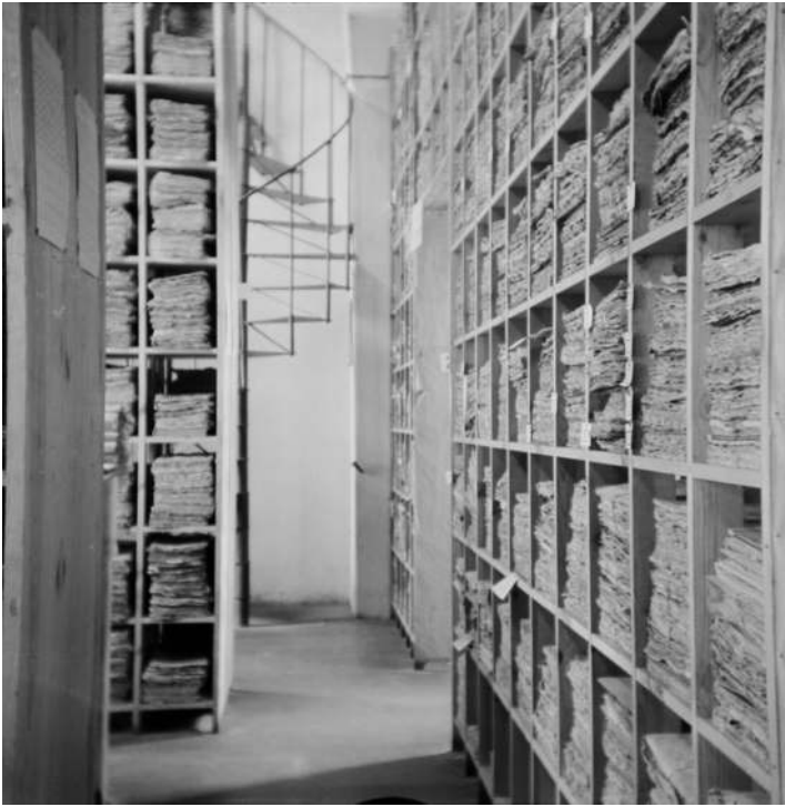
Abb. 2: Landesarchiv Lübben: Magazinraum.