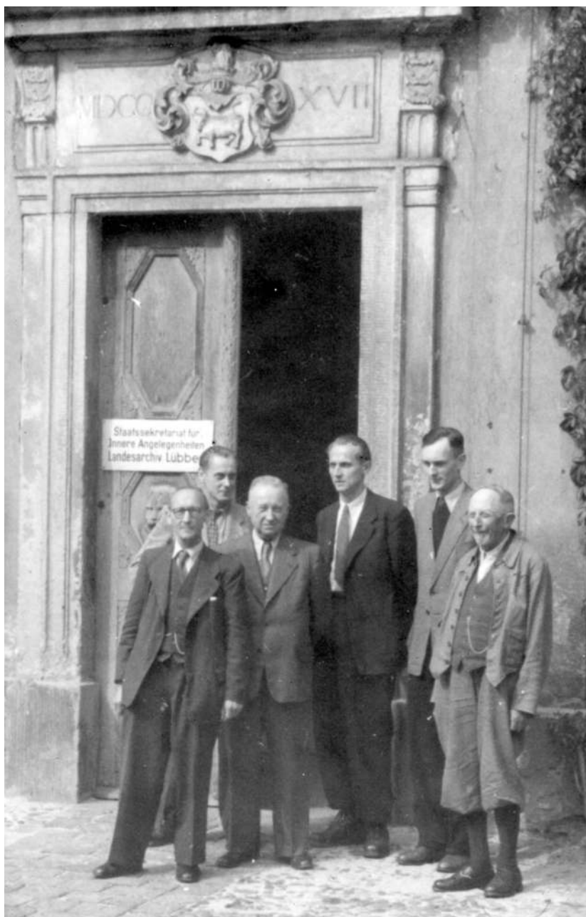
Abb. 5: Arbeitsgemeinschaft für geschichtliche Landeskunde am Landesarchiv Lübben, 1956.