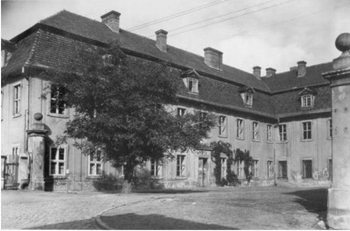
Abb. 1: Landesarchiv Lübben (ehemaliges Ständehaus), 1952.