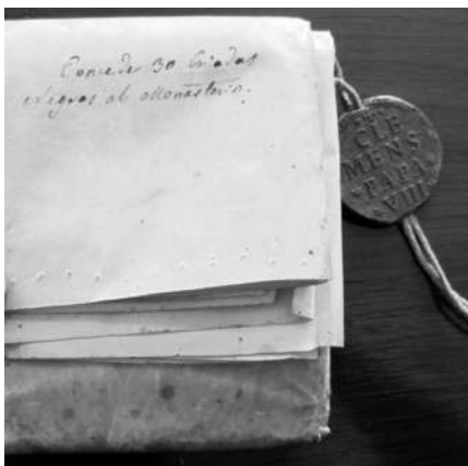
Fig. 1. Bula del Papa Clemente VIII a doña Inés concediendo la posesión de 30 criadas negras al Monasterio (1594).