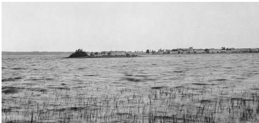
Köyliönjärven Kirkkokari vuonna 1905

sitä lähin kuivan maan alue. Säilyneiden asiakirjalähteidenkin perusteella Pyhän Henrikin kappeli on ollut olemassa noin vuoteen 1422 mennessä. 176 Varsinkin ennen Köyliönjärven järvenlaskua Kirkkokari oli pinta-alaltaan niin pieni 177 , että kappelin rationaalisesti ajatellen älyttömällä rakentamisella juuri sille on täytynyt olla vahva symbolinen merkitys. Sekin on aihetodiste.