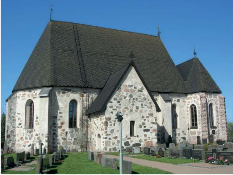
Nousiaisten Pyhän Henrikin keskiaikainen kirkko

Excursus: Mihin herra Heinärikki alun perin haudattiin? Nousiaisten kirkon kuuluisan sarkofagin kuvituksessa noin vuodelta 1429 piispa Henrikin ruumis kannetaan paareilla maakellarista sisään kirkkoon sarkofagiin haudattavaksi. 161 Piispa Henrikin alkuperäiseksi hautapaikaksi on historiallisissa lähteissä väitetty Nousiaisten myöhäis-keskiaikaisen kivikirkon ja sen mainitun sarkofagin paikan lisäksi Nousiaisten Moisiota (Nummen kylässä); (vanhemmassa) tutkimuskirjallisuudessa nimensä perusteella myös Nousiaisten kivikirkon vieressä sijaitsevan Topoisten tilan vuonna 1712 mainittua Kalmopeltoa