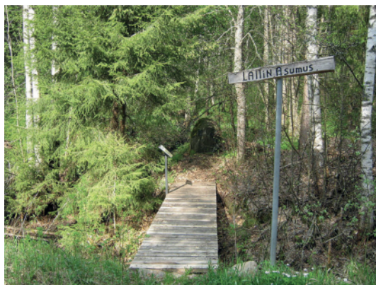
Lallin asumus eli Lallinmaja Köyliössä

Mitä ilmeisimmin Pyhän Henrikin legendaa nuorempaa, mutta kuitenkin jo hyvän aikaa ennen keskiajan päättymistä syntyneitä Lalliin kytkeytyvää perinnettä edustaa vuonna 1753 julkaistu tarina hänen onnettomasta hukkumiskuolemastaan hiirten tai hiirten hahmoisten pahojen henkien/pirujen ahdistelemana Köyliönjärvestä noin kaksikymmentäkilometriä luoteeseen sijainneeseen Harjavallan (sittemmin kuivatettuun) Hiirijärveen. Kuten jo Martti Haavio osoitti, kyse on nimen Hiirijärvi alkuperäselitykseksi valjastetusta yleiseurooppalaisesta keskiaikaisesta ns. Mäuseturm-tarinasta, jossa paha ihminen saa surmansa hiirten ahdistamana. 453 Nimi Hiirijärvi