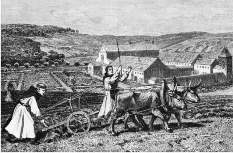
Sisterssiläisiä munkkeja maatoissa luostarinsa edustalla

äännelaillisesti kehittynyt muinaisranskan sana Gaule [gaulə] 250 ? Varhaislänsisuomeen se olisi lainautunut asussa *Kavlimaa , joka juuri (huom.) Mynämäen ja Nousiaisten murteessa olisi kehittynyt äännelaillisesti muotoon Kaalimaa (vrt. suomen yleiskielen kaula ~ Mynämäen ja Nousiaisten murteessa kaal < *kavla < *kayla < kakla 251 ). 252 Surmarunon Kaalimaa ei voine merkitä Varsinais-Suomen Kalantia , vaikka sellaistaakin on arveltu 253 , koska