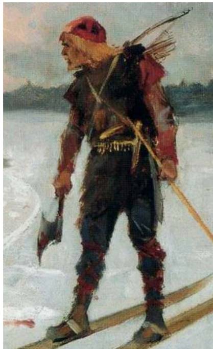
Albert Edelfeltin näkemys Lallista

Herra Heinärikin murhaajan nimen Lalli (~ Lalloi ) alkuperästä on esitetty monia arveluja. 423 Ehkä eniten ja pisimpään tutkimuskirjallisuudessa esillä ollut etymologiointiehdotus on nimen Lalli olettaminen latinankielisen nimen Laurentius kansanomaiseksi suomalaiseksi muodoksi. Pidän kuitenkin kronologisista syistä liki mahdollottomana, että Heinärikin enemmän tai vähemmän pakana-