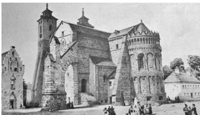
Kuvassa Lundin tuomiokirkko vuonna 1839