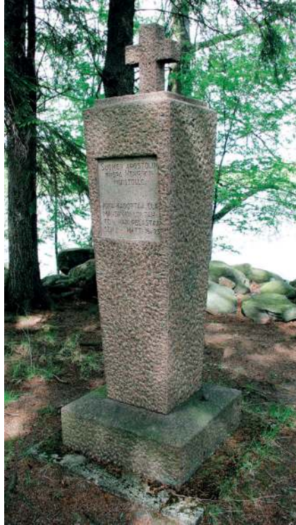
Köyliönjärven Kirkkokari muistomerkkeineen

Voikin kysyä, miksi juuri Köyliössä sijaitsi piispankartano ja miksi se sijaitsi juuri Köyliönjärven saarella, mikäli kertomuksilta piispa Henrikin murhasta Köyliössä Lallin kädestä puuttuvat kaikki todellisuuskytkennät. Köyliönjärven pinta-alaltaan varsin pienen Kirkkokarin (St. Henriks Holm v. 1688) Pyhän Henrikin kappelin perustamisen ajoitus 1300-luvun lopulle rahalöytöjen perusteella todistaa, että kyseisen paikan (ja sitä kautta Köyliön pitäjän) jo tuolloin uskottiin olevan Henrikin murhapaiikka tai ainakin