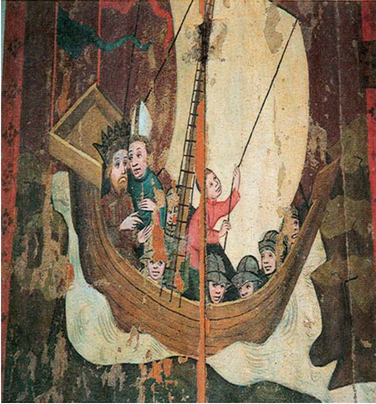
Kaksi oli pyhämiestä, kristiveljestä jaloa