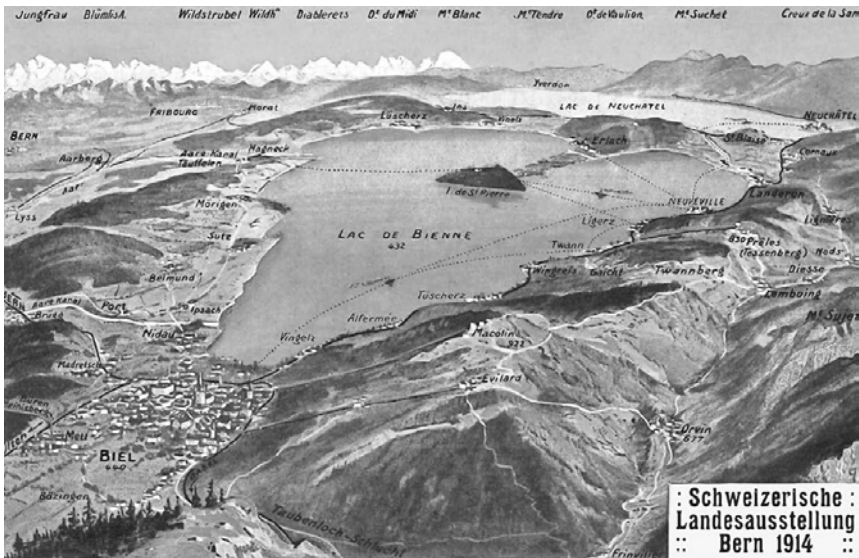
Abb. 1 33

den Rêveries von 1799 begann, ungemindert fort. Besonders radikal inszeniert er die wörtliche ›Absetzung‹ von seinem literarischen Vorbild im vierten Brief: Hier berichtet Obermann von einer unvergesslichen Nacht, die er am Ufer des Lac de Neuchâtel verbracht hat – jenem See, der dem Bieler See und der Île de Saint-Pierre direkt gegenüberliegt. Da die Wahl des Ortes an dieser Stelle eine wichtige Rolle spielt, sei die Lage der beiden Seen anhand einer Karte verdeutlicht (s. Abb. 1).