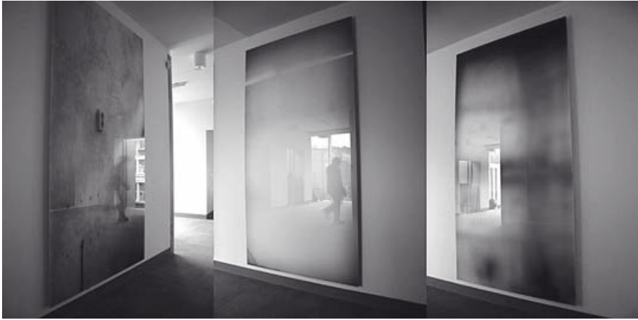
Abb. 3: Alison Dalwood: Time Visible as Moving Light , von links nach rechts: Wallpaper, Striplight, Tiles , 2007, University of Ulster. Fotografien unter milchigem Perspex, jeweils 280 x 150 cm.