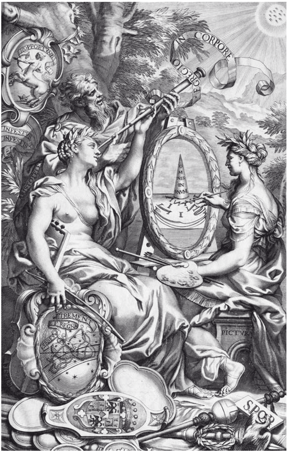
Abb. 4: Frontispiz aus Emanuele Tesauro Il Cannocchiale Aristotelico (1670).