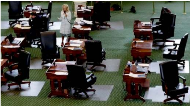
Abb. 1: Wendy Davis im Juni 2013 im Senat von Texas in Austin: Filibuster gegen die geplante Verschärfung des Abtreibungsgesetzes