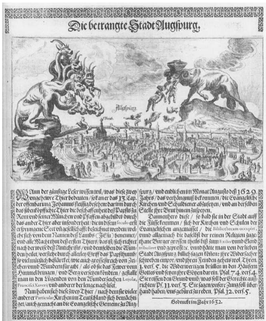
Abb. 1: »Die betrangte Stadt Augspurg«. Der Text erläutert die Szene: Wenn der Leser wissen will, »was diese zwey vngewehre Thier bedeuten, so kann er das 13. Cap. der offenbarung Johannis fleissig besehen: darin durch das sibenköpffige Thier die beschaffenheit des Papstes zu Rom vnd seiner Mönchen vnd Pfaffen abgebildet, durch das ander Thier aber insonderheit, die in diesem seculo erst ersprungene Sect vnd gesellschaft bezeichnet worden, welche sich von dem Namen des Lambs (Jesu) benennet, vnd alle Macht thut dess ersten Thiers, das ist, sich richtet nach der weise des Antichrists.«

Quelle: Wolfgang Harms (Hrsg.), Illustrierte Flugblätter aus den Jahrhunderten der Reformation und der Glaubenskämpfe, Coburg 21983, 461.