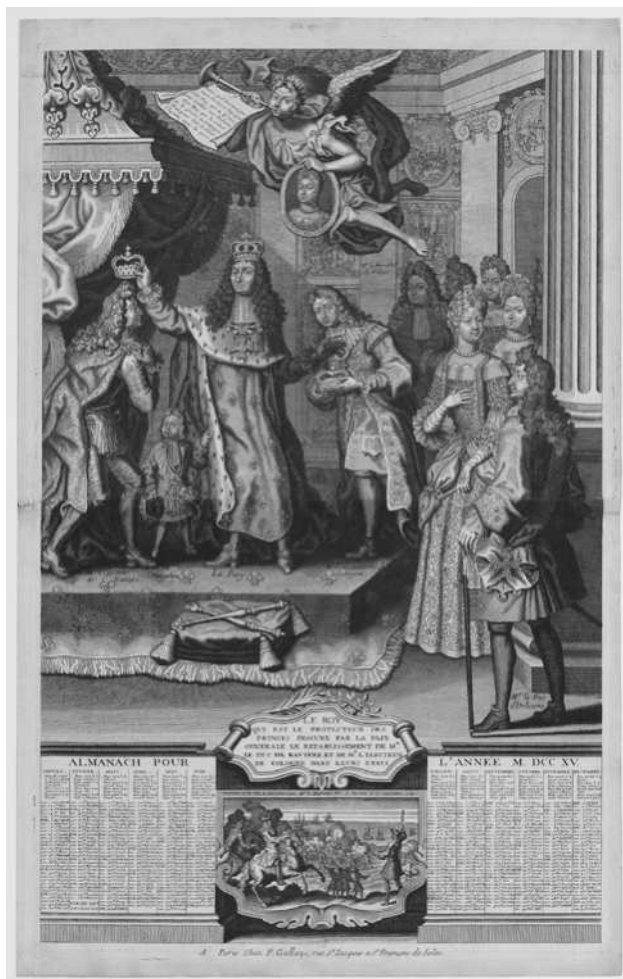
Abb. 1: [Anonymus], Le Roy, qui est le protecteur des Princes procure par la paix générale le rétablissement de M. le Duc de Bavière et de M. l'électeur de Cologne dans leurs Etats, Paris 1715 (Bibliothèque Nationale de France, Paris).

finanziell abhängigen und hoch verschuldeten Klienten und Kostgängern geworden 74 .