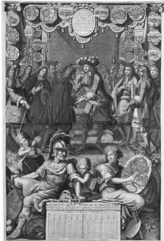
Abb. 1: LES EFFETS DE LA PUISSANTE PROTECTION/du Roy enuers ses Alliez: Les Remerciemens des Souuerains et Estats à qui il a/ procuré la Paix; Et l'Accueil fait par sa Ma. te au Prince Guillaume de Furstemberg. Nicolas Langlois (Paris) 1680 (BNF- IFN- 6945453).

Protektion funktionierte über mehrere Jahrhunderte hinweg als Begriff und Praxis der französischen Politik, weil Frankreich als Korrelativ zu anderen, insbesondere den Habsburgern, agierte. In dieser Konstellation war Protektion kein bloßer französischer Propagandabegriff, sondern etwas, das Protegierte suchten, nachfragten und bei allen Gefahren und Bedenken positiv konnotierten 57 .