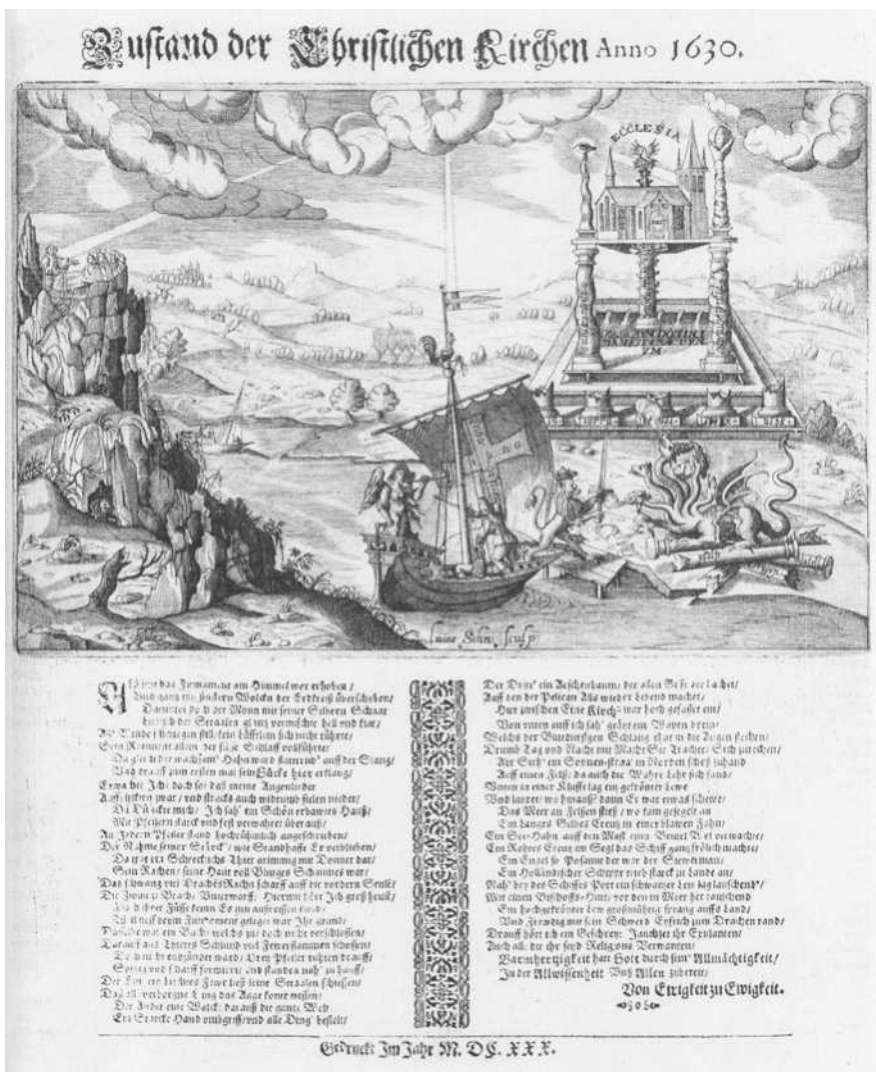
Abb. 2: »Zustand der Christlichen Kirchen Anno 1630«. Wieder wird der Papst als das siebenköpfige Tier der Apokalypse dargestellt, denn dieses trägt die päpstliche Tiara. Am Ende des Textes wird die Ankunft Gustav Adolfs als Rettung gefeiert: »Ein hochgekrönter Lew großmüthig sprang auff's Land Vnd Frewdig mit sein Schwerd Eyfrich zum Drachen rand. Darauff hört ich ein Geschrey: Jauchzet ihr Exulanten Auch all die ihr seyd Religions-Verwandten. Barmhertzigkeit hatt Gott durch sein Allmächtigkeit In der Allwissenheit Vnß Allen zubereit.«