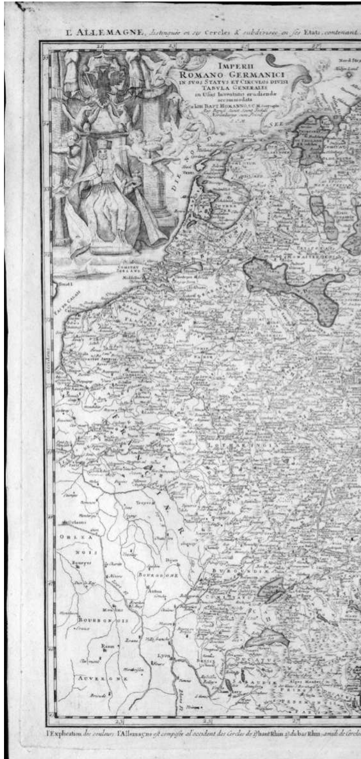
Abb. 1: Die brandenburgisch-preußische Monarchie um 1741. Die kolorierte Karte im Reichsmaßstab führt bereits das soeben eroberte Schlesien als Besitzung des preußischen Königs auf; Ansbach und Bayreuth (in der Mitte) gingen freilich erst später in den Besitz der Hauptlinie der Hohenzollern über. Das Fürstentum Neuchâtel – unten links, im Original blau schraffiert – war damit lange Zeit das mit großem Abstand südlichste Territorium der Monarchie. Quelle: Johann Baptist Homann, Imperii Romano Germanici in suos status et circulos divisi tabvla generalis in usus iuventutis erudiendæ , Nürnberg 1741, ca. 1:2'500'000 (Totiae Borussiae Regnum, Falz 13). Digitalisat: ZB Sammlung Ryhiner (6101 13).