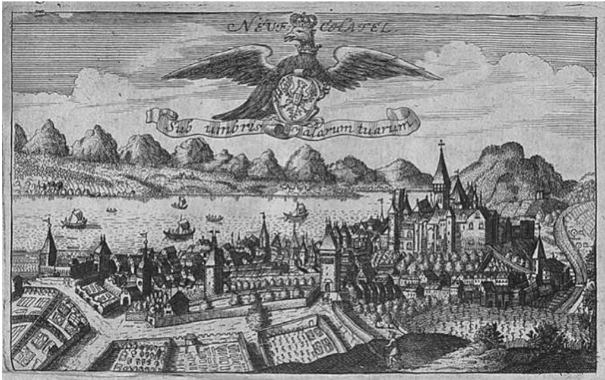
Abb. 2: Sub umbris alarum tuarum – Protektion als Herrschaftsdevise (1708).

Das Titelbild des wenige Monate nach der preussischen Sukzession gedruckten Werks des Hallenser Juristen und späteren königlichen Geheimrats Ludewig verbindet die an Psalm 17,8 ( sub umbra alarum tuarum proteges me – »Beschütze mich unter dem Schatten deiner Flügel«) orientierte, auch im Reichskontext verbreitete Herrschaftsdevise des Hauses Brandenburg mit dem Neuenburger Wappen.