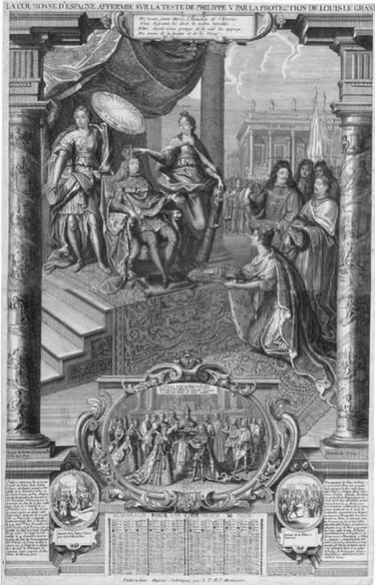
Abb. 2: LA COURONNE D'ESPAGNE AFFERMIE SVR LA TESTE DE PHILIPPE V PAR LA PROTECTION DE LOUIS LE GRAND 1702. Henri Bonnard (Paris) 1702.