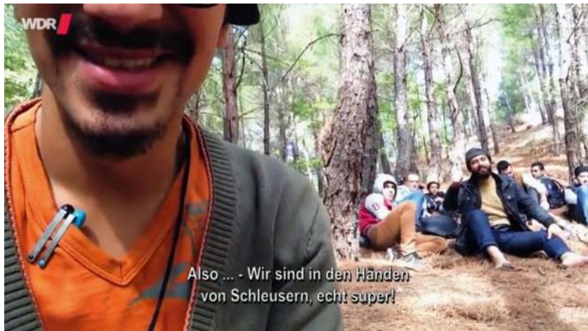
Meine Flucht: Selfie-Video

Meist wird das Selfie in der breiten Diskussion über digitale Kultur als Form einer narzisstischen Selbstinszenierung geschmäht. Sich mit einem filmenden Telefon zu sich und seiner unmittelbaren Umwelt in Beziehung zu setzen und sich zu ihr verhalten zu können, kann im Sinne des Konzepts der anthropomedialen Relation jedoch eine stabilisierende und selbstermächtigende Funktion haben. Mit dem Handy in der Hand kann man gewissermaßen zum Zuschauer der eigenen Situation werden, was auch entlastend wirken kann. In Meine Flucht wird das Handyvideo eines Mannes gezeigt, der mit seinem kleinen Sohn und weiteren Geflüchteten von den Schleusern im leeren Benzintank eines Busses über die Grenze geschmuggelt wurde. In dem dunklen Video sieht man nur eine hellgraue Metallwand, mit einem winzigen Loch, durch das die Eingeschlossenen mit dem