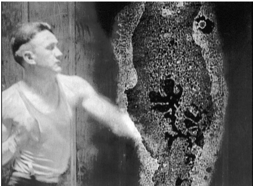
Decasia: Boxer kämpft mit der Auflösung des Zelluloids

Decasia kommt vollständig ohne Offkommentar aus und verzichtet als ein eher an der Materialität des Zelluloids interessierter Experimentalfilm auf Narration, im Sinne einer erzählerischen Figurenhandlung. Dennoch entsteht hier etwas, das im Kapitel zu William James' Stream of Thought als eine Dramaturgie