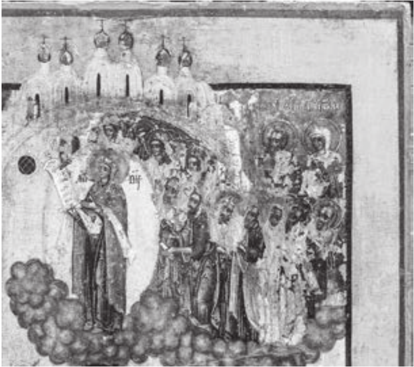
Megrin luostarin Jumalanäidin suojelus -ikoni, 1700-luku (osa).

Suomessa tunnettiin läntinen ja Karjalassa itäinen vaippa-traditio hyvin. Lohjan, Hattulan, Kalannin ja Paraisten kirkoissa on kalkki-maalauksina Mater misericordiae -aiheen muunnelmia. 379 Karjalassa pokrova ikoneineen oli suosittu juhla, joka osui karjan navettaan paluun rituaalien ajankohtaan ja ehkä siksi siitä tuli monen karjalaisen kirkon nimikkopraasniekka. 380