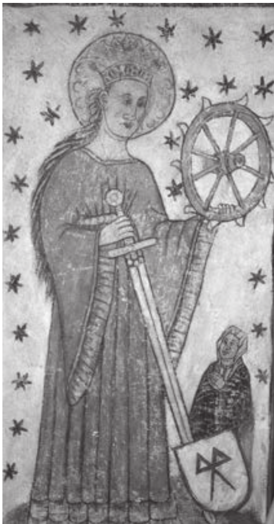
Kalannin (1936 asti Uusikirkko) kivikirkon Pyhä Katariina Aleksandrialainen on kuvattu kalkkimaalauksessa kidutuspyörän kanssa. Pyhälle Olaville omistetussa kirkossa on runsaasti seinämaalauksia, jotka on tehty vuosien 1470–1471 tienoilla.