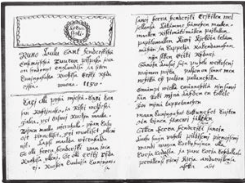
Piispa Henrikin surmavirren ensimmäinen säilynyt muistiinpano alkuaan Anders Törnudd vanhemman, sittemmin Th. Reiniuksen kokoelmasta.

käsiälällä kirjoitettu”, toteaa Haavio. 198 Tämä Suomalaisen Kirjallisuuden Seuran arkistossa säilytettävä vihkonen on ulkoasultaan loistelas poikkeus kansanrunomuistiinpanojen joukossa. Se imitoi locus sigilli -tekstillä ja piirroksella auktoritatiivista kirjaa tai käsikirjoitusta. Kaikki nämä piirteet viittaavat siihen, että tekstin tallentaja on pitänyt runoa merkittävänä ja arvokkaana ja on halunnut osoittaa sen lukijoille. Samat piirteet olivat tuttuja kuninkaallisista ja kirkollisista virallisista julistuksista ja painanteista, ja niitä käytettiin myös ahkeraan niiden käsikirjoitetuissa kopiaissa. 199