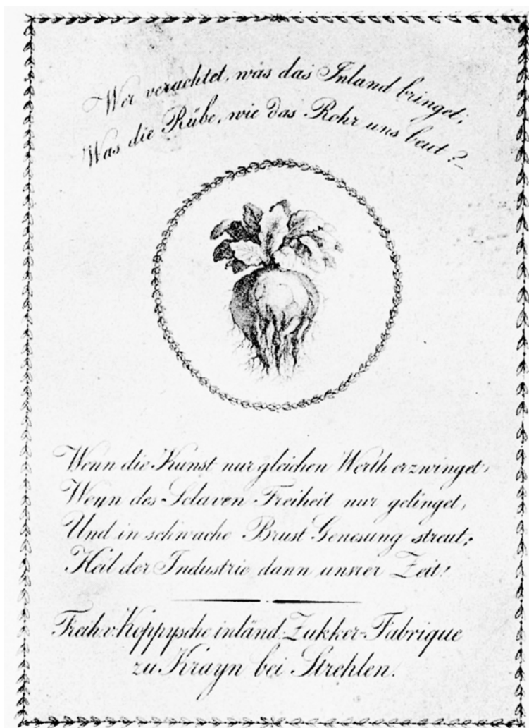
Abbildung 1: Moritz von KOPPY, Werbeblatt für die Freiherr von Koppysche inländische Zucker-Fabrikue zu Krayn bei Strehlen (um 1810):

»Wenn die Kunst nur gleichen Werth erzwinget, Wenn des Slaven Freiheit zur gelingt, Und in schwache Brust Genesung streut; Heil der Industrie dann unsrer Zeit!«