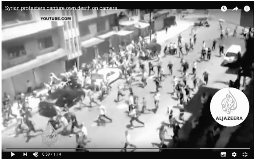
Abb. 5: al-Jazeera English (2011): Syrian protesters capture own death on camera

Im Voiceover berichtet Stephanie Dekker ohne Pause weiter: »But another video, which was posted online from the same day and location in Homs, seems to tell the same story. The Syrian government makes it very difficult for journalists to approve from inside the country. So we rely on videos uploaded to the Internet or sent to us by citizens to get an idea of what is happening inside Syria.« Wir verfolgen mit einem unruhigen Kamerabild, wie der Menschenstrom nachlässt und eine anscheinend angeschossene Person von mehreren anderen zwischen zwei am Straßenrand parkenden Autos getragen wird. Plötzlich läuft eine einzelne Person von den parkenden Autos aus in die entgegengesetzte Richtung diagonal zur anderen Straßenseite. Sie befindet sich alleine auf der Straße als erneut Schüsse fallen. Die Person beginnt zu taumeln und fällt regungslos zu Boden. Im Synchronon hören wir ein nahes »Ohhh...!« einer Männerstimme und aufgeregte Frauenrufe im Hintergrund. Das Voiceover fährt fort: »At times it's difficult to establish precise facts. But videos like these appear to show the systematic, brutal