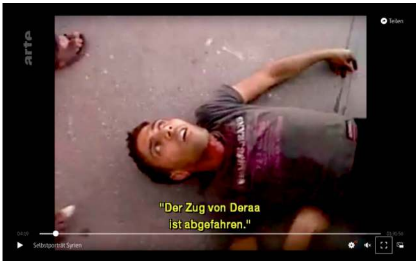
Abb. 8: EAU ARGENTÉE (2013) (F, R: Mohammed/Bedirxan) : Et le cinéma fut

Schnitt. Das blutverschmierte Gesicht des eben noch auf der Straße liegenden Demonstranten fixiert uns mit leeren Augen. Er ist in ein weißes, blutbeflecktes Leinentuch gewickelt und liegt seitlich auf einer Bahre. Während die Kamera das Gesicht des Toten abfährt und uns seine Wunden von Einschusslöchern zeigt, spricht Mohammed im Off in gleichbleibender Tonlage auf Arabisch weiter