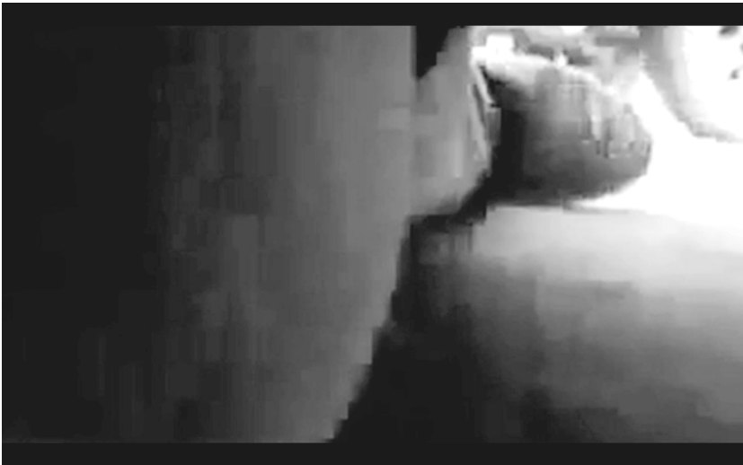
Abb. 4: ABSTRAKTER FILM (2013) (D, R: Hein)

hält die montierten Szenen von Konfliktmomenten zusammen, in denen die Aufnahme außer Kontrolle gerät und nur eine vermittelte Gewalterfahrung die Bilder vorantreibt. Eine Kontrolle über Bild und Aufnahme, die mit der digitalen Kameratechnik gegenüber der analogen Filmtechnik gewonnen wird, geht im Moment des Schusses verloren (vgl. Gespräch mit Hein 2015). Eine kompromisslose Gewalt übermannt die Filmenden, die Aufnahme und uns als Betrachtende. Das Auslösen des Schusses fügt sich dabei in einen fortlaufenden Aufnahmemodus ein, der ohne intendierten Endzeitpunkt das Geschehen aufzeichnet und unbehaglich gehaltlose Bilder hervorbringt.