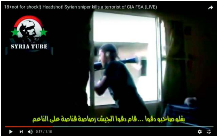
Abb. 21: GazpromFan 18 (2013a): 18+not for shock!) Headshot! Syrian sniper kills a terrorist of CIA FSA (LIVE)