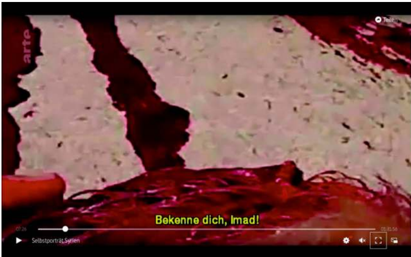
Abb. 11: EAU ARGENTÉE (2013) (F, R: Mohammed/Bedirxan): Le premier martyr (Imad)

stets körperlich ist und einen materiellen Träger voraussetzt, »selbst in seinen virtuellen Formen« (ebd.: 112), und diese Materialität auch stets das ist, worum politisch gekämpft wird – insbesondere wenn es um Forderungen wie den Zugang zu und die Verfügbarkeit von Nahrung, Beschäftigung, Institutionen und Mobilität geht – erscheint EAU ARGENTÉE als eine cineastische Rematerialisierung des körperlichen Handelns der syrischen Protestteilnehmenden. Mit dieser wird nicht mehr nur der Erscheinungsraum der Straße und über die Materialisierung im Onlinevideo der Erscheinungsraum des Internets performativ hervorgebracht und als öffentlicher beansprucht. Wenn die syrischen Protestteilnehmenden mit der filmischen Übersetzung ihrer Videobilder auch im Erscheinungsraum des Kinos körperlich präsent werden, erschaffen und okkupieren sie zur selben Zeit das Kino als öffentlichen Raum des syrischen Widerstands. EAU ARGENTÉE ist damit Ausdruck eines Kampfes um den Platz des syrischen Widerstands im öffentlichen Erscheinungsraum des Kinos: um seinen Zugang zu und seine Sichtbar- und Bedeutsamkeit in diesem.