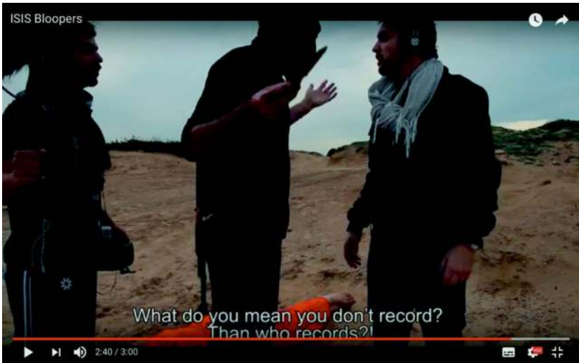
Abb. 29: beerech (2015): ISIS Bloopers

lässt sich entsprechend von einem veränderten Zeugenschaftsszenario sprechen, wenn die Akteure dieser erweiterten sozialen Sphäre als bestätigende, widerlegende oder wertende sekundäre Zeugen in Erscheinung treten. In dieser Erweiterung mag das Zeugnis in unveränderter Form weitergeführt, abgewandelt oder widerlegt werden. Es kann überlagert und verstärkt, oder abgeschwächt und sogar ausgelöscht werden.