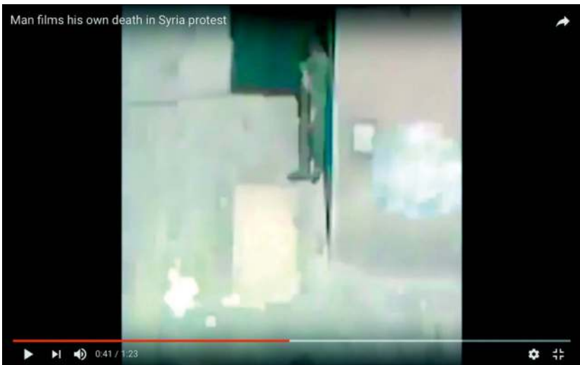
Abb. 1: netspanner (2011): Man films his own death in Syria protest

An dieser Szene setzt Mroués Performance an (vgl. WRO Art Center 2013). Die folgenden Bilder fangen wieder den sich nähernden Todesschützen ein. Er hat sich bis zur Ecke des Gebäudes vorgearbeitet und erscheint nun in voller Größe im Bildausschnitt: Bekleidet mit einem grünen Springeranzug hält er ein Gewehr in Bereitschaftsposition. Er bringt das Gewehr in Anschlag. Das Bild bleibt verwackelt. Es verliert kurz den Mann mit dem Gewehr und zeigt ein weiteres Fragment des Wohngebäudes, während im Hintergrund aufgeregte Rufe und das Hantieren mit dem Handy zu hören sind. Das Bild findet den Mann in schussbereiter Position wieder. Ein alles übertönender Schuss erschallt und die Aufnahme fällt völlig aus dem Rahmen: Ein helles, fast grelles Bild gefolgt von einem rotkarierten Bild und begleitet von knackenden, dumpfen Tönen, als würde etwas auf den Boden fallen, sind zu sehen. Dann folgen wieder helle, zunächst weiße, danach gelbliche Bilder und schließlich weißgrauer Stillstand. Auch auf der Tonebene herrscht einige Sekunden lang Stille bis eine wimmernd murmelnde Männerstimme und eine weitere, aufgeregt arabischsprechende Männerstimme lauter werdend ertönen. Nach