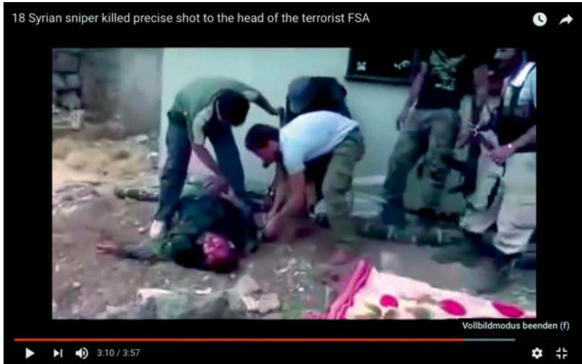
Abb. 15: SaraNews (2015): 18 Syrian sniper killed precise shot to the head of the terrorist FSA

» Maru Lolst we want to watch more COD:waw in real life so i watch this.....im 12« (SaraNews 2015)