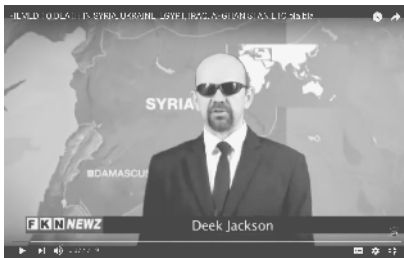
Abb. 24: Deek Jackson (2014): FILMED TO DEATH IN SYRIA, UKRAINE, EGYPT, IRAQ, AFGHANISTAN ETC bla bla (1) , Abb. 25: Deek Jackson (2014): FILMED TO DEATH IN SYRIA, UKRAINE, EGYPT, IRAQ, AFGHANISTAN ETC bla bla (2)

und zu einer Nahaufnahme eines jungen Mädchens überblendet wird. Es hat einen breiten Verband um den Kopf gebunden, der ihre Stirn, ihre Augen und ihre linke Gesichtshälfte bedeckt. Auch ihre linke Schulter ist verbunden. Ihr dunkles Haar ragt hinten aus dem Verband hervor. In der rechten Bildhälfte ist ein Arm zu sehen, der den Rücken des Mädchens stützt, während sie aufrecht sitzend und zur Kamera gerichtet, die Lippen bewegt. (vgl. Abb. 25)