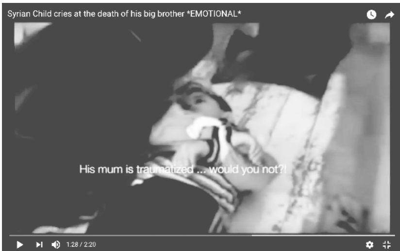
Abb. 16: EsToSa S (2013): Syrian Child cries at the death of his big brother *EMOTIONAL*

Judith Butler (2009: 36) wirft die Frage nach den impliziten Rahmen auf, die die Annehmbarkeit eines Wir einer gemeinschaftlichen Verantwortlichkeit füreinander herstellen und regulieren. In der Betrachtung des Todesleids des Anderen werden die scheinbar starren Grenzen eines menschlichen Wir als beweglich und als Resultat einer Normierung sichtbar, die über die Ausstellung der Betrauerung und Betrauerbarkeit bestimmter Leben im Syrienkonflikt funktioniert. Die Zugehörigkeit zu einem Innen und Außen und dessen Bestimmung und Regulierung wird damit zu einer Politik des Affekts, in der nicht weniger als die Bedeutung bestimmter verloraener Leben ausgehandelt wird. Diese schließt eine Politisierung des Todesleids ein, wie sie sich in der Überlagerung der ›Third-person‹-Handy-Todesvideos mit einer christlichen Motivgeschichte zeigt. So rechtfertigt der martyrisierte Tod eines Gefallenen im Sinn einer religiösen bzw. göttlichen Legitimierung eine als reaktiv markierte Gewalt. Gleichzeitig wird im Kampf um die Aufrechterhaltung eines unbeteiligten Wir das Menschliche – die Zuordnung zu oder der Ausschluss aus diesem – zur letzten grenzsetzenden Maßnahme.