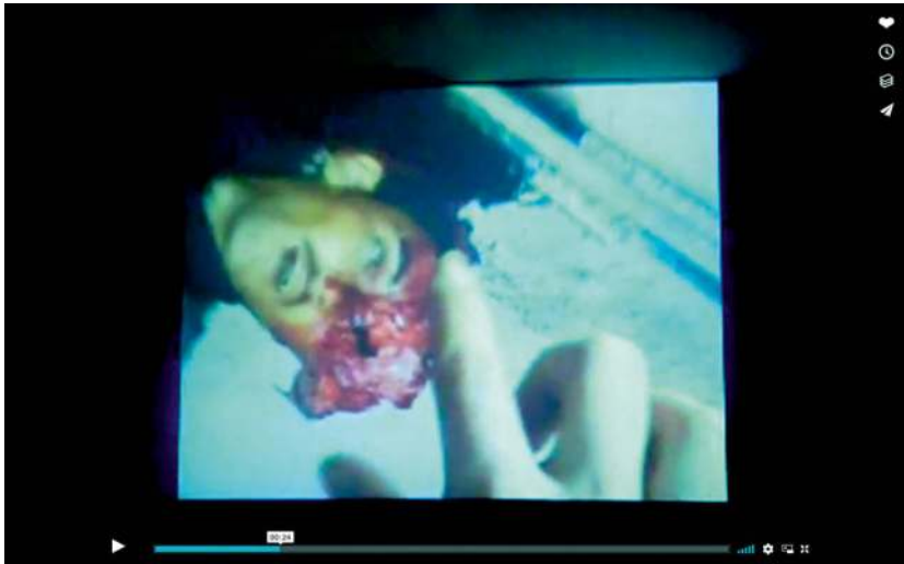
Abb. 31: Anouli Patchouli (2012): Touching Reality , Thomas Hirschhorn

Diese Betrachtbarkeit des Todes des Anderen, die auch in den Handy-Todesvideos eingeschrieben ist, bringt damit eine Lesbarkeit dieser als Obszönität hervor, mit der sie zum Abjekten zu gerinnen droht. Diese Gefahr zeigt sich besonders deutlich, wenn ein Besucher in Antwort auf seine eigene ablehnende Reaktion auf die Videoinstallation und einen öffentlichen Vortrag Thomas Hirschhorns 60 ein eigenes Video nach Hirschhorns Vorbild produzierte, das ausschließlich diese Lesbarkeit der Betrachtbarkeit des Todes des Anderen als Obszönität reproduziert: Die zerstörten Körper werden durch zerstörte Bäume ersetzt. Die betrachtende Geste und die Komposition der Bilder bleiben jedoch dieselben. (vgl. Dario Ré 2016)