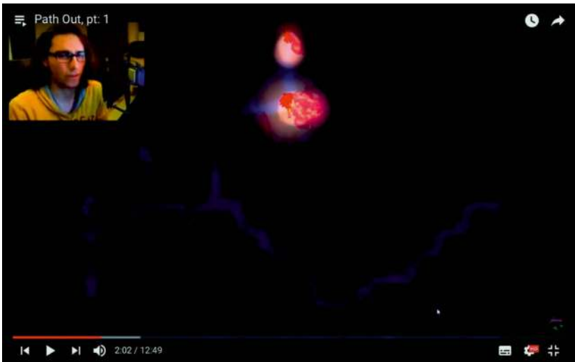
Abb. 32: RPGtime (2018a): Path Out, pt: 1

Blicken wir von hier aus auf das Syria-Tube -Video (vgl. Kapitel 4.1.2) materialisiert sich in Path Out eine eigene Obszönität des Todes: Der nicht-aktualisierte Tod des Anderen in Form der gelungenen Flucht Abdullahs wird im Spiel zu einer aktualisierten Spielmöglichkeit, wenn wir die Spielfigur ›Abdullah‹ durch unsere Spielentscheidungen töten. Hierbei werden wir explizit zu Verantwortlichen seines fiktionalen Todes gemacht, wenn bei Eintritt des Todes der Spielfigur 63 Abdullah