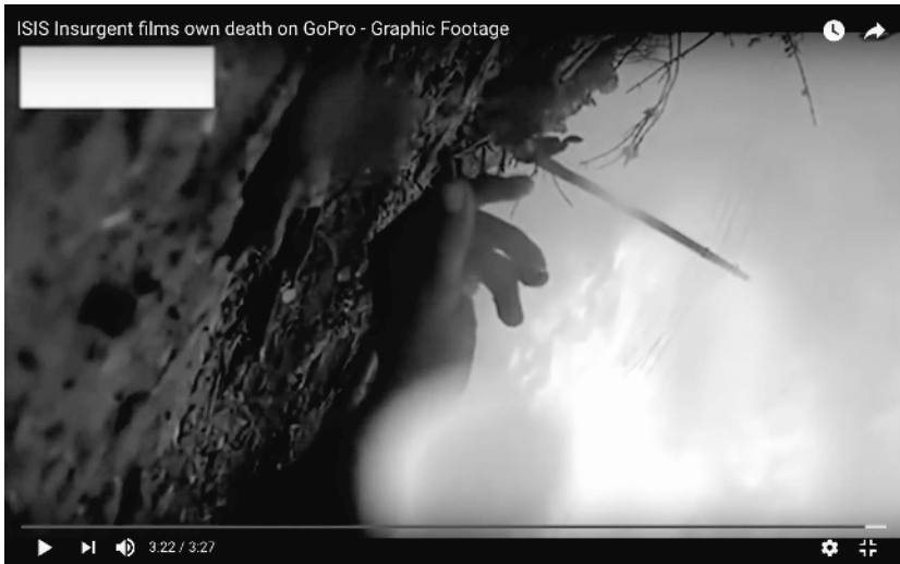
Abb. 14: squidd81 (2016): ISIS Insurgent films own death on GoPro – Graphic Footage