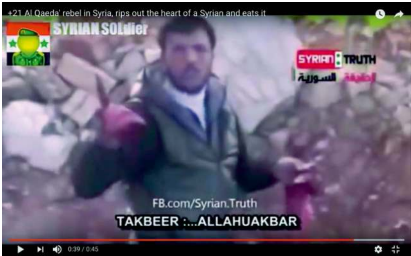
Abb. 23: ForMotherSyria (2013): +21 Al Qaeda' rebel in Syria, rips out the heart of a Syrian and eats it.