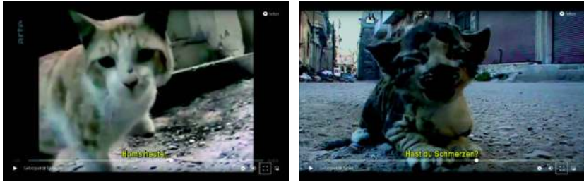
Abb. 17: EAU ARGENTÉE (2013) (F, R: Mohammed/Bedirxan): État de Siège , Abb. 18: EAU ARGENTÉE (2013) (F, R: Mohammed/Bedirxan): Miaou

ein drängendes Miauen aus als wollte es ihre Frage bejahen. Ausblende. (vgl. ebd.: 00:59:17-00:59:31; Abb. 18) 11