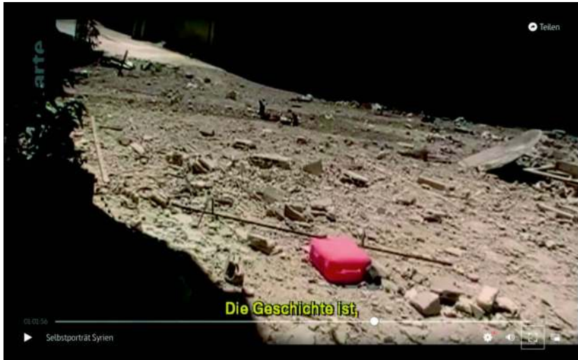
Abb. 13: EAU ARGENTÉE (2013) (F, R: Mohammed/Bedirxan): Die Geschichte ist...

Das Kino bzw. das cineastische Ereignis entsteht mit EAU ARGENTÉE nicht vor dem Bild mit den stattfindenden Protesten und gewaltsamen Ausschreitungen auf den Straßen Syriens und dem, was sie dort zurückließen. Es entsteht nicht hinter dem Bild mit einer dokumentarisch informierten filmenden Handlung, die zwischen einem Außerhalb und Innerhalb des Geschehens oszilliert. Es entsteht auch nicht im Bild, wie es in The Pixelated Revolution mit der paradoxen Erfahrung der cineastischen Ver-/Erkennung suggeriert wird. Das cineastische Ereignis entsteht nach dem Bild: in der Nachträglichkeit der Betrachtung und Weiterverarbeitung der Videos, wenn ein professioneller Filmschaffender mit den Bildern syrischer Videografierender und ihren Erzählungen seine Filmgeschichte des Überlebens und Sterbens in Syrien schreibt.