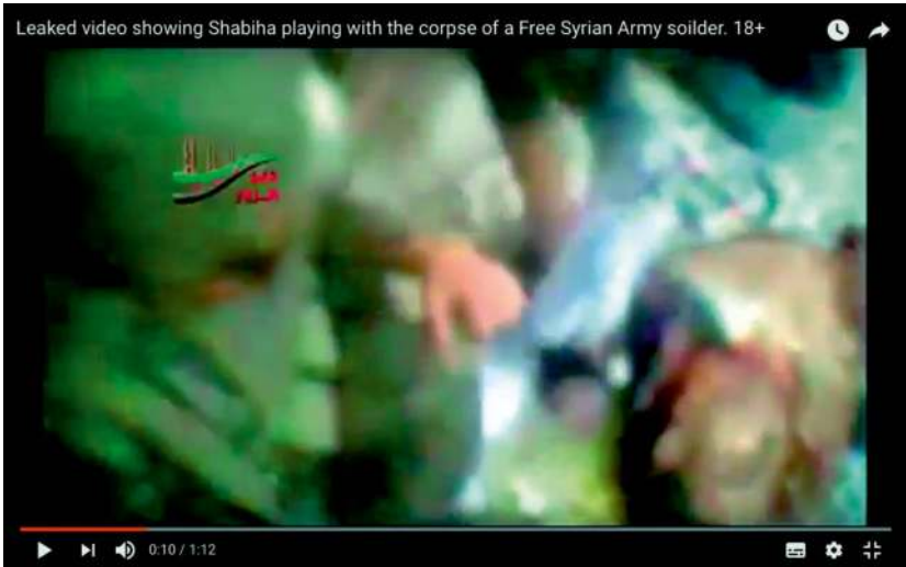
Abb. 22: SyrRevoDiary English (2013): Leaked video showing Shabiha playing with the corpse of a Free Syrian Army soilder [sic]. 18+

die sich unter dem Stichwort ›Leaked-/Cell-phone-secret‹-Videos (vgl. souriamyheart 2012a u. 2012b) 22 zusammenfassen lassen, begleitet und ihre Betrachtung mit einem spezifischen Unbehagen belegt.