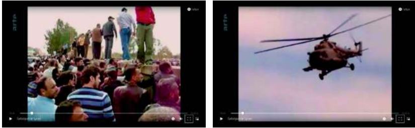
Abb. 9 u. 10: EAU ARGENTÉE (2013) (F, R: Mohammed/Bedirxan): Le premier martyr – Schuss (links) & Gegenschuss (rechts)

Plötzlich sehen wir rötlichen, in Falten geworfenen Stoff, dann Straßenasphalt in groben Pixeln und schnell wechselnde Bilder in Hauttönen, dunkle und helle Schatten, Blut auf dem Asphalt und zu nahe Aufnahmen von bekleideten Körpern. Der Wind verfängt sich im Mikro und die Rotorblätter haben die gesamte Audioebene eingenommen. Es ertönen Schreie und kreischende Stimmen vor wechselnden, abgerissenen Bildern. Immer öfter taucht der Asphalt, bedeckt mit großen Blutlachen, in diesen Bildern auf. »Bekenne dich! Sprich dein letztes Gebet, Imad!« ruft eine Stimme auf Arabisch. Am unteren Bildrand taucht eine Blutspur neben einem blutverschmierten Haarschopf auf. »Bekenne dich, Imad!« ruft die Männerstimme immer und immer wieder bis ein unerträgliches Kreischen das Audio erfüllt. (vgl. Abb. 11)