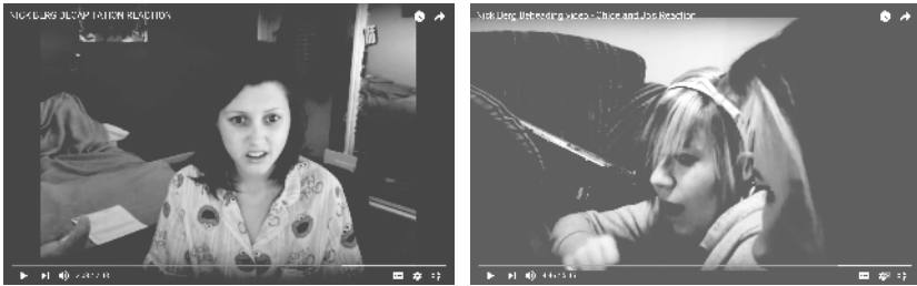
Abb. 27: Jamie Mitropoulos (2015): NICK BERG DECAPITATION REACTION, Abb. 28: imanemoprincess (2015): Nick Berg Beheading video – Chloe and Jo's Reaction

wird sichtbar, wenn die Ausstellung der eigenen körperlich affektiven Reaktion auf die Betrachtung eines Enthauptungsaktes zum Antrieb der Selfie-Filmenden wird und damit das Selfie-Reaktionsvideo und mit ihm das Enthauptungsvideo in den Bereich eines unterhaltsamen Todesspektakels verschoben wird (vgl. imanemoprincess 2015; Abb. 28).