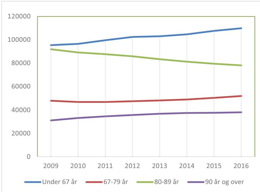
Figur 2. Antall mottakere av helse- og omsorgstjenester 2009–2016 etter alder. 3 Antall mottakere av helse- og omsorgstjenester varierer etter alder. Figuren viser perioden fra 2009 til 2016. I dette tidsrommet er det aldersgruppen under 67 år som klart har den største økningen. I tall øker denne aldersgruppen fra omkring 95 500 til omkring 110 000 personer. De mellom 67 og 79 år samt de mellom 80 og 89 år øker kun lite i antall i perioden, men med den yngste av disse gruppene på et høyere nivå. For aldersgruppen mellom 80 og 89 år derimot er det en klar nedgang, fra 92 000 til 78 000.

og matutbringning. Mens eldre over 67 år (tidligere 65 år) hele tiden har vært og fortsatt utgjør den dominerende mottakergruppe, er det samtidig skjedd en viktig endring over tid, som illustrert ved figur 2.