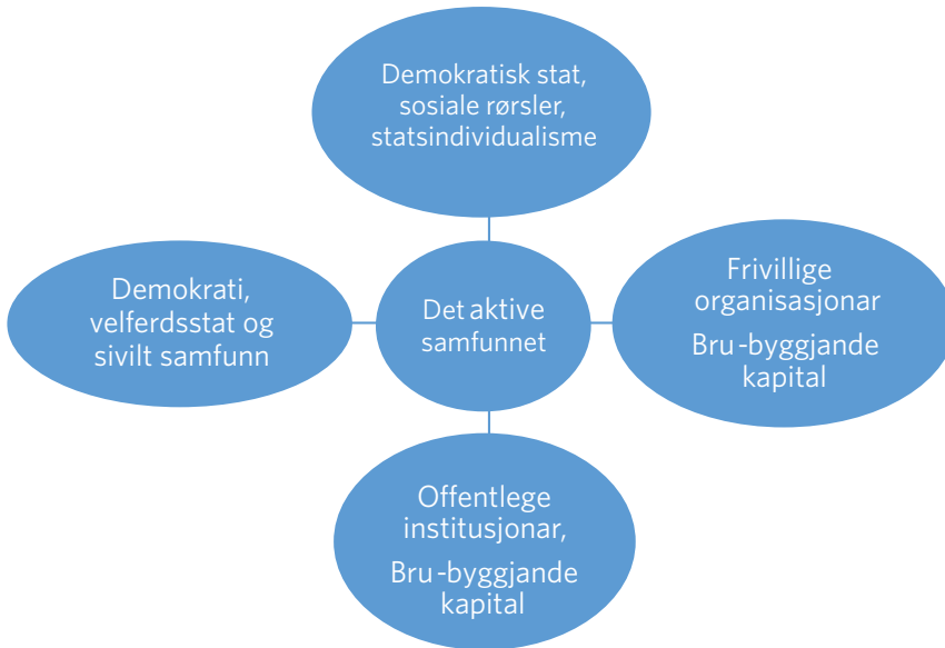
Figur 1. Analysemodell.