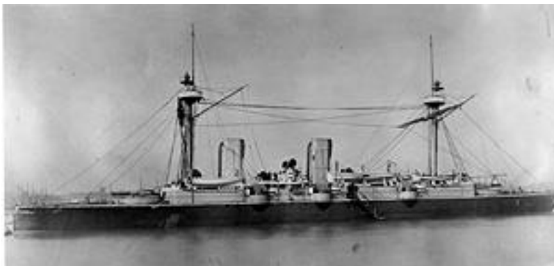
Crucero protegido Esmeralda (3 o )