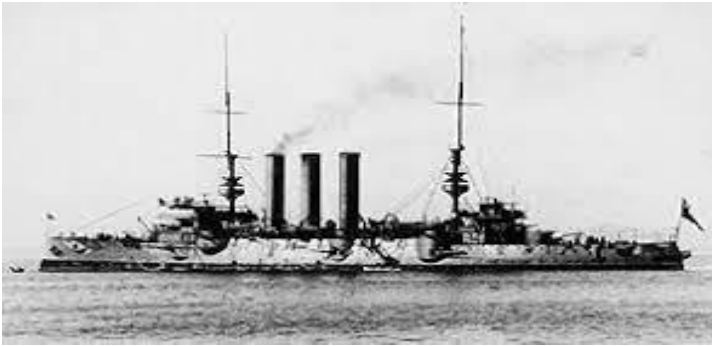
Crucero acorazado O'Higgins