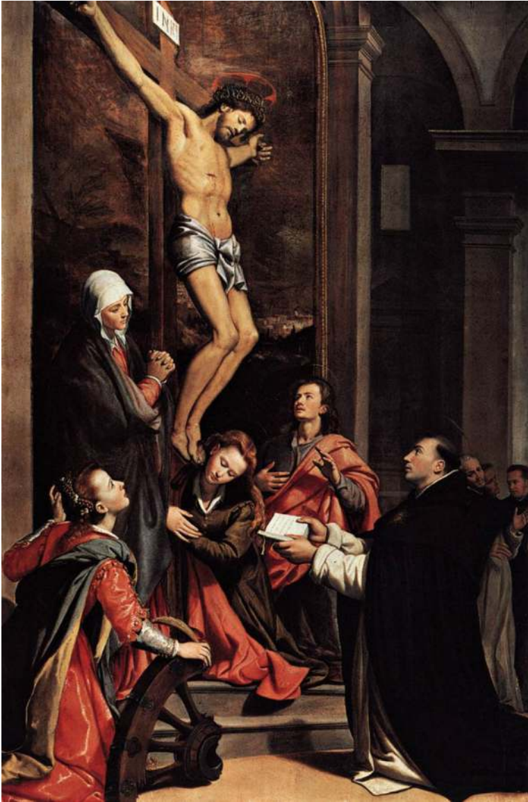
Bild 10. Santi di Tito, Korsfästelse med helgon , 1593. Olja på pannå. 362 × 233 cm. San Marco, Florens (Italien).