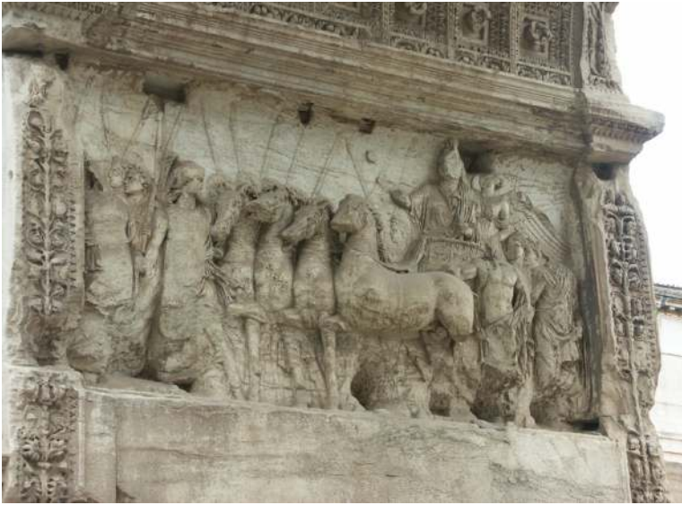
Bild 2. Reliefen på Titusbågens nordöstra sida, 82 e.Kr.