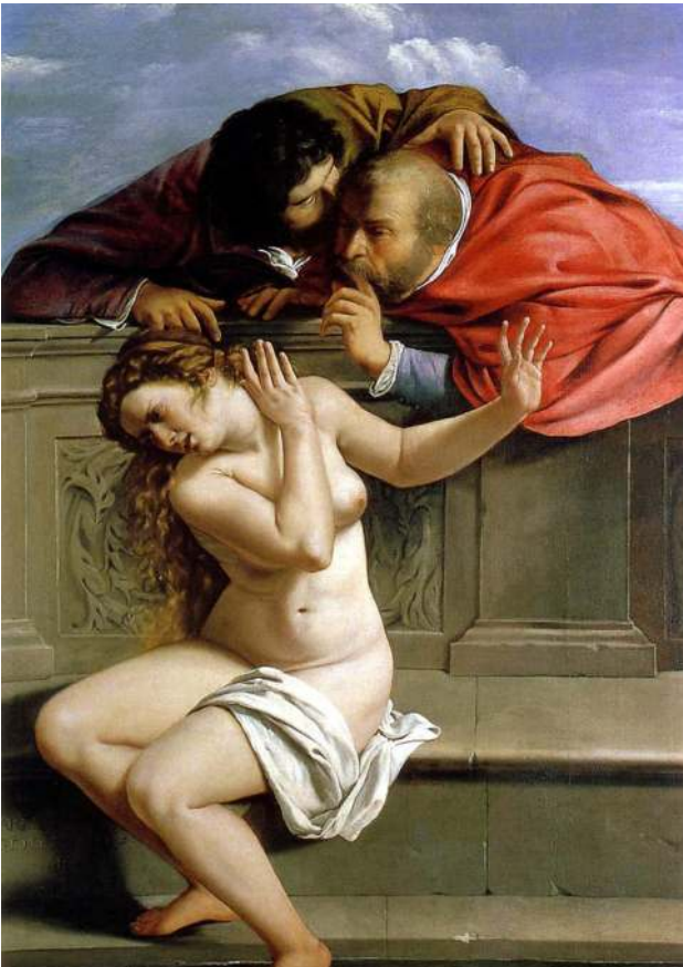
Bild 8. Artemisia Gentileschi, Susanna i Badet , 1610. Olja på duk. 170 × 119 cm. Schloss Weißenstein, Pommersfelden (Tyskland).

I bildkonsten är blickar i hög grad aktiva agenter. Det gäller blickar som fälls, möts och agerar inne i bilderna, i det estetiska rummet. Men också blickar som rör sig i det reella rummet, utanför och kring konstverken. Spelet mellan det estetiska