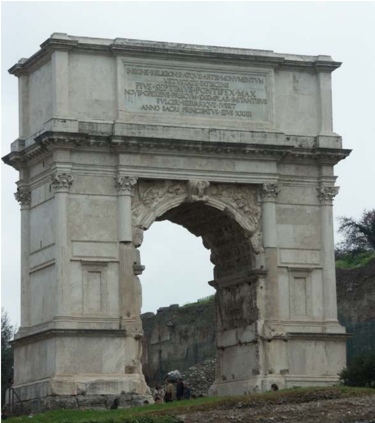
Bild 1. Titusbågen i Rom, uppförd 82 e.Kr.

Jerusalem år 70 efter Kristus. I triumftåget längs Via Sacra färdades fältherren tillsammans med sin far kejsar Vespasianus, sina romerska soldater, judiska krigsfångar och erövrade troféer, främst bland dem menoran, den sjuarmade ljusstaken från templet i Jerusalem som lagts i ruiner. Passagen genom en triumfbåge gjorde triumfen tydlig och påtaglig samtidigt som den markerade en övergång från krigets värld till den civila världen i huvudstaden