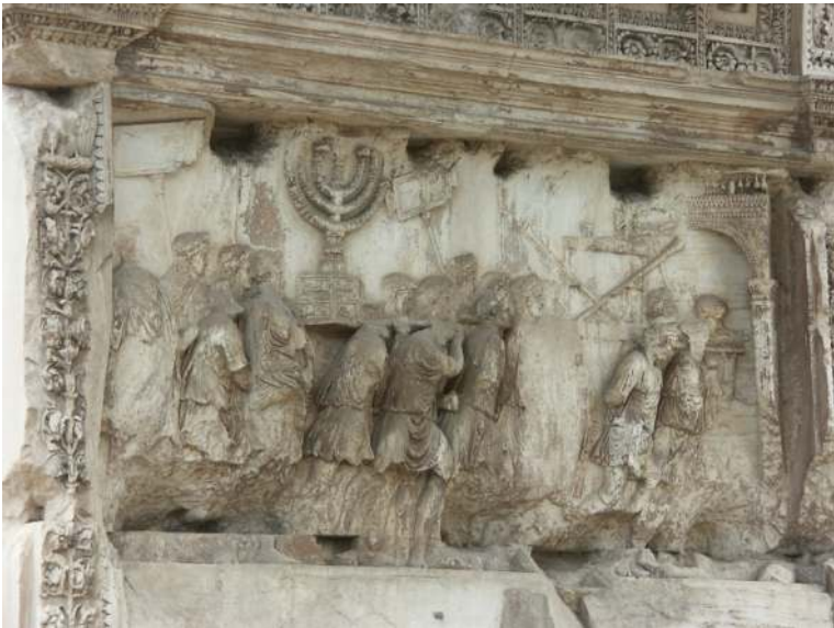
Bild 3: Reliefen på Titusbågens sydvästra sida, 82 e.Kr.