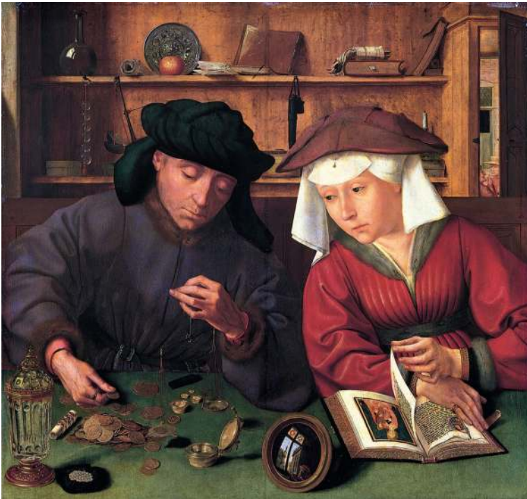
Bild 9. Quentin Matsys, Myntväxlarna , 1514. Olja på pannå. 71 × 67 cm. Louvren, Paris (Frankrike).

Stämningläget är mycket mer stillsamt här än i Susannabilden och allt tycks till att börja med vara i bästa harmoni (bild 9). 8 Två personer sitter vid ett