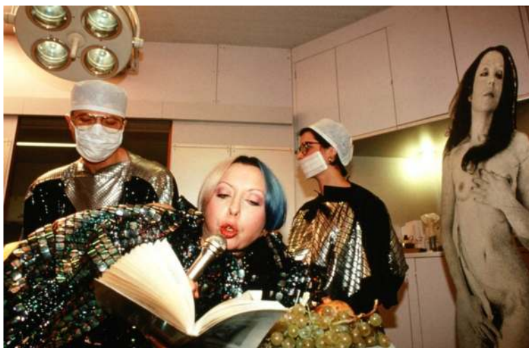
Bild 12. ORLAN, Lacan Operates: Reading and Proceed to Act with Paco Rabanne dress . Serie: 4th Surgery-Performance Titled Successful Operation. Date: 8 december 1991. Cibachrome diasec mount. 65 × 43 inch.