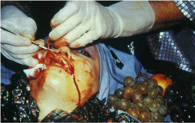
Bild 14. ORLAN, 4th Surgery-Performance Titled Successful Operation . Serie: 4th Surgery-Performance Titled Successful Operation . Date: 8 december 1991. Cibachrome diasec mount. 65 × 43 inch. Fotograf/institution: ORLAN (Copyright CC-BY- NC-ND)

måste kontexten där den sker vara accepterad som en "konventionell procedur" (som ingåendet i äktenskap), den som utför handlingen vara skäligen passande samt att proceduren måste fullföljas av samtliga inblandade (det blir inget äktenskap om en säger nej). 28 Om vi utgår från detta kan vi säga att ett performance är ett konstativt uttryck så länge som vem som helst kan utföra det utan att dess primära betydelse förändras. 29 På samma sätt är bildmotivet ansiktet-som-kanon konstativt eftersom det kan opereras fram på vem som helst (även om antalet nödvändiga operationer skulle variera).