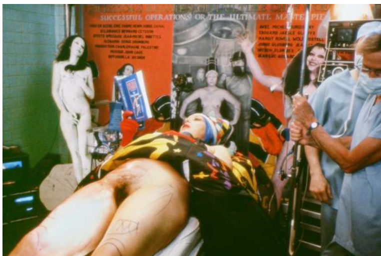
Bild 13. ORLAN, I'm reading, he's operating me . Serie: 5th Surgery-Performance Titled Operation Opera. Date: 6 july 1991. Cibachrome diasec mount. 65 × 43 inch.