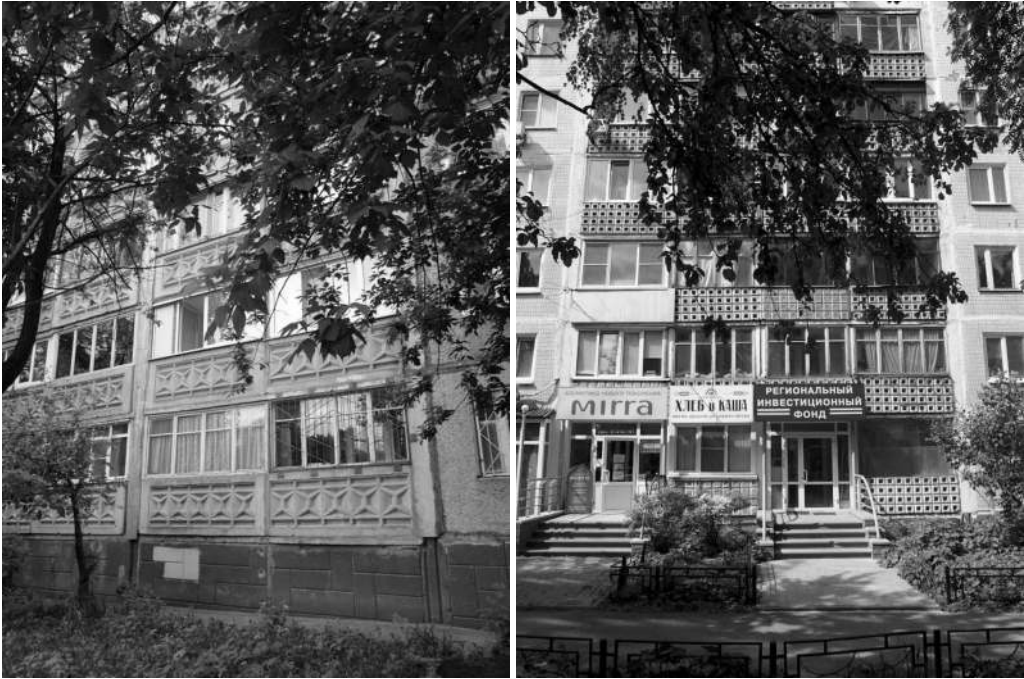
Abb. 1: Formsteine in Nischnij Novgerod 6