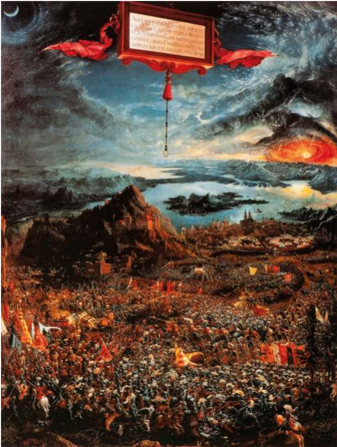
Abbildung 1: Albrecht Altdorfer, Alexanderschlacht, Öltempera auf Lindentafel, 158 x 120, 1528–29, Alte Pinakothek, München.

dessen, was die Modernen seit Johann Gustav Droysen die hellenistische Epoche nennen.