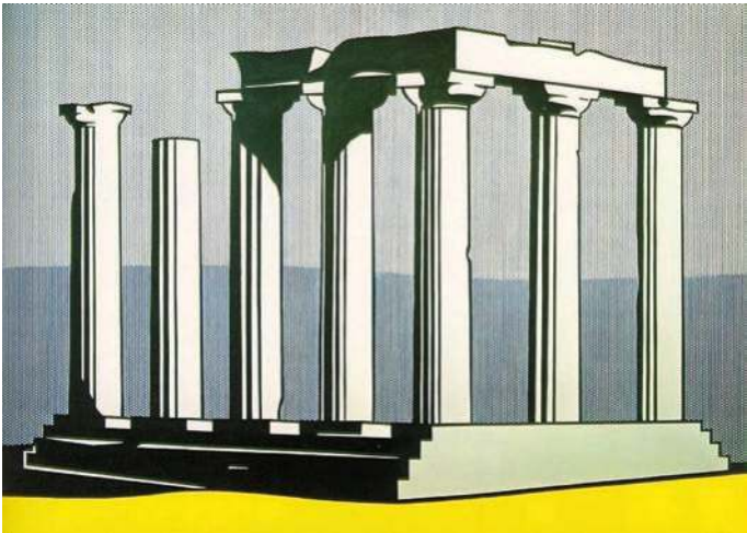
Abbildung 2: Roy Lichtenstein, Apollotempel, Öl und Acryl auf Leinwand, ca. 239 x 325 cm, 1964, Privatsammlung.

und Weise nutzen kann. Das Objekt Griechenland wird gleichzeitig vertrauter und rückt in die Ferne. Zwar kann man die berühmten Ruinen sehen, fotografieren, durchstreifen, die tausendjährigen Steine berühren: man begibt sich also in ihre unmittelbare Nähe; aber wie soll man noch glauben, dass alles, was sich dort in diesen kleinen Orten unter der brütenden Sonnenhitze ereignet hat, uns noch angehen kann, während wir uns beeilen, wieder in die Kühle der klimatisierten Reisebusse zurückzukehren, die mit laufendem Motor auf dem Parkplatz warten? Es handelt sich doch nur um eine Anhäufung toter Steine, die man ständig neu befestigen und wiederverwerten muss. Seit den frühen 1980er Jahren geht es zunehmend um die Tourismusindustrie, aber auch um jene des Kulturbes.