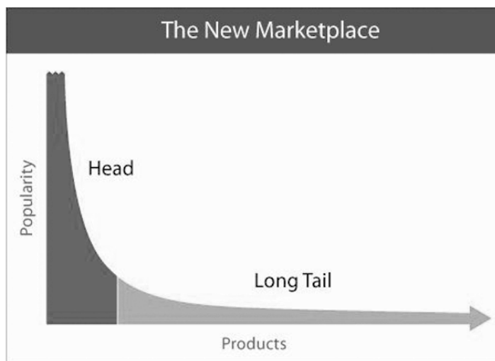
Abbildung 3: Illustration des Long Tail (von Chris Anderson)